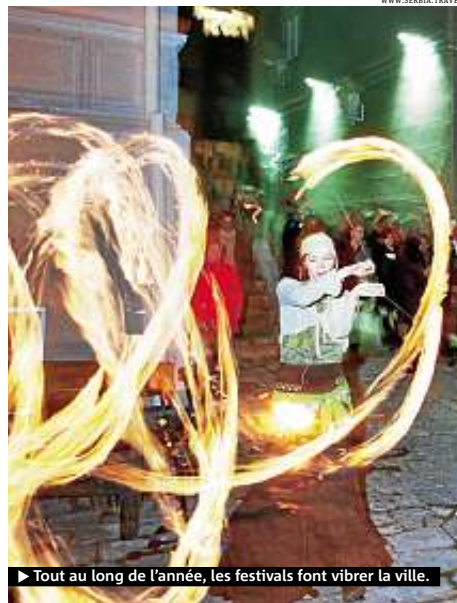
▶ Tout au long de l'année, les festivals font vibrer la ville.

Après le dîner, qu'il n'est pas rare d'achever en dansant debout sur les tables, direction Strahinjica Bana, la légendaire rue des bars. Surnommée la Silicon Valley en référence au nombre de bimbos retouchées qui la fréquentent, cette enfilade d'adresses branchées est devenue le haut lieu de la nuit belgradoise. On y boit, on y danse et même on y fume, la loi antitabac n'étant pas (encore) passée par là. Pour se déhancher jusqu'à l'aube, les clubs sont légion, du Neuvième étage, avec vue sur la ville à l'Andergraund, niché dans une grotte, en passant par le Magacin, dans un hangar face au port, ou le Baratuna, un ancien entrepôt d'armes du XVII e siècle. A l'arrivée des beaux jours, c'est sur le Danube ou le long du fleuve Save que les festivités se délocalisent. Des dizaines de péniches et de radeaux métalliques (les "splavovi") accueillent les noctambules dans une atmosphère déjantée. Et le lendemain, on prend les mêmes et on recommence.