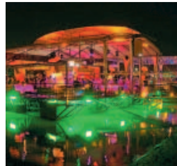
Une des fameuses "Splavovi". ■