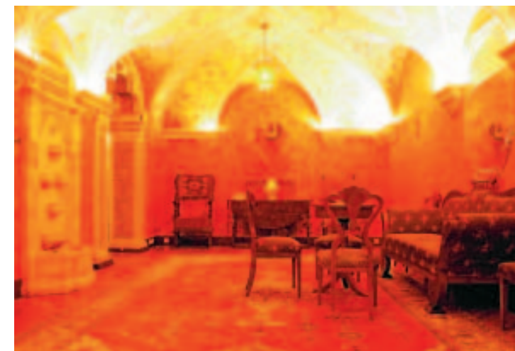
Le Palais Royal, une merveille architecturale. ■ J.K.