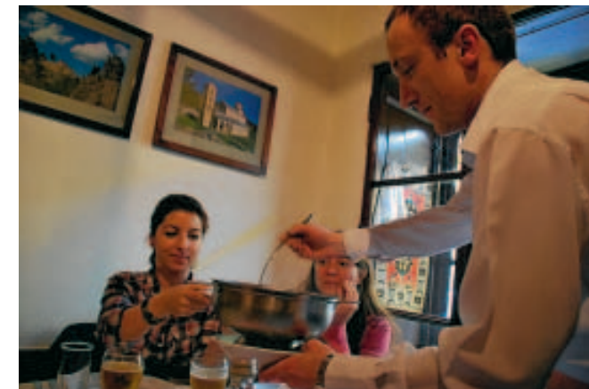
Une cuisine généreuse comme les gens de là-bas. ■ J.K.

Construite en 1820, c'est la plus ancienne taverne traditionnelle de Belgrade. Ancienne propriété du prince Milos Obrenovic, qui l'a offert à son financier. Ce n'est qu'en 1826, qu'elle a été transformée en taverne. En 1892, elle portait le nom "A la cathédrale". Jugé irrévèrentieux par l'Église, son propriétaire, n'ayant pas d'idées pour lui trouver un autre nom et sous la pression, a, de rage, décidé de mettre un simple point d'interrogation. Un nom assez particulier pour un restaurant, mais qui a finalement traversé le temps et les guerres. Il est, depuis lors, devenu une des curiosités de la ville. Située rue Kralja Petra, à Stari Grad, elle propose une cuisine et une musique traditionnelle. Tiens en par-