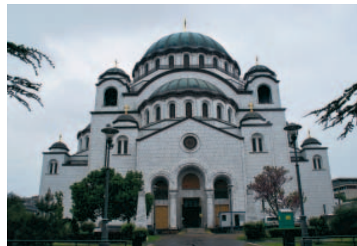
L'impressionnante cathédrale Saint Sava.