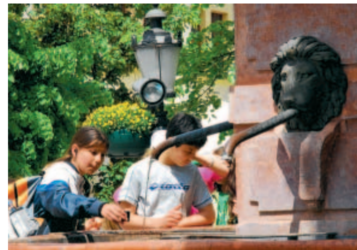
Novi Sad, c'est un peu la Provence en version balkanique. ■ J.K.

Novi Sad est une ville connue par ses événements culturels et festivals comme: Théâtre de Sterija, Festival du film et des médias "Cinéma City" et le plus grand festival de musique en Europe du Sud-est - Exit... L'Université de Novi Sad a 19 facultés et des départements spécialisés où les cours sont donnés dans les langues des minorités nationales ou spécialisés dans leur étude. Grâce aux excellentes conditions pour la viticulture, les vignobles de