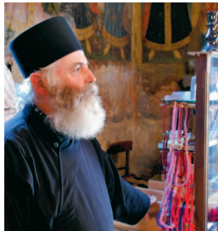
L'Église orthodoxe est fort présente en Serbie. ■ J.K.

leries et ses restaurants nationaux qui vous serviront des plats typiquement serbes. Le tout au rythme envoûtant des chants traditionnels serbes et des guitares tsiganes. Riche de son passé historique, le berceau de Belgrade, c'est aujourd'hui un grand parc proposant quelques musées et galeries, com-