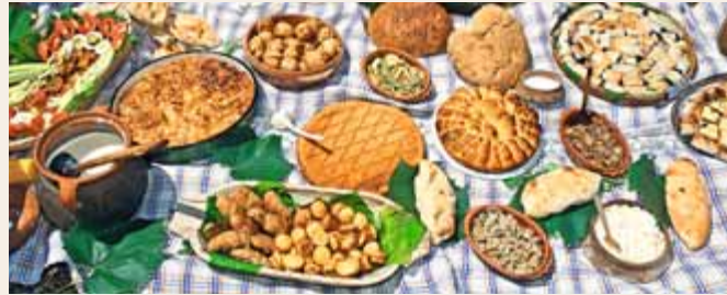
Bereit fürs Picknick: eine Auswahl an deftigen Vorspeisen der serbischen Küche

In Serbien werden stattliche Portionen serviert. Als Vorspeise isst man