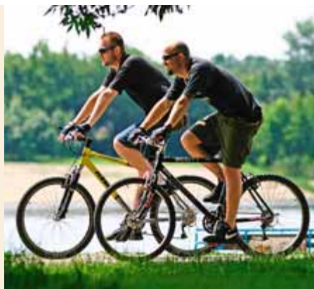
Biker auf Ada Ciganlija radeln entlang der Sava. Die Halbinsel am Zusammenfluss mit der Donau ist das beliebteste Erholungsgebiet Belgrads

Das Fahrrad ist in Serbiens Hauptstadt beliebt, Radwege sind verbreitet. I bike Belgrade bietet geführte Touren auf Englisch an (4 Std. € 17/ Pers., 00381-669008386, http://ibikebelgrade.com ). Dabei geht es an den Donau- und Savaufeln entlang bis zur Vorstadt Zemun, wo es richtig ländlich wird. Zu sehen bekommt man unterwegs Bauten aus der kommunistischen Ära wie den gebieterisch wirkenden Serbien-Palast und das »Hotel Jugoslavija«. Zur wärmeren Jahreszeit starten in Belgrad Bootstouren, gleich neben der Mündung der Sava in die Donau; günstiger Preis, knapp € 4 für ein bis anderthalb Stunden. Eine gute Gele-