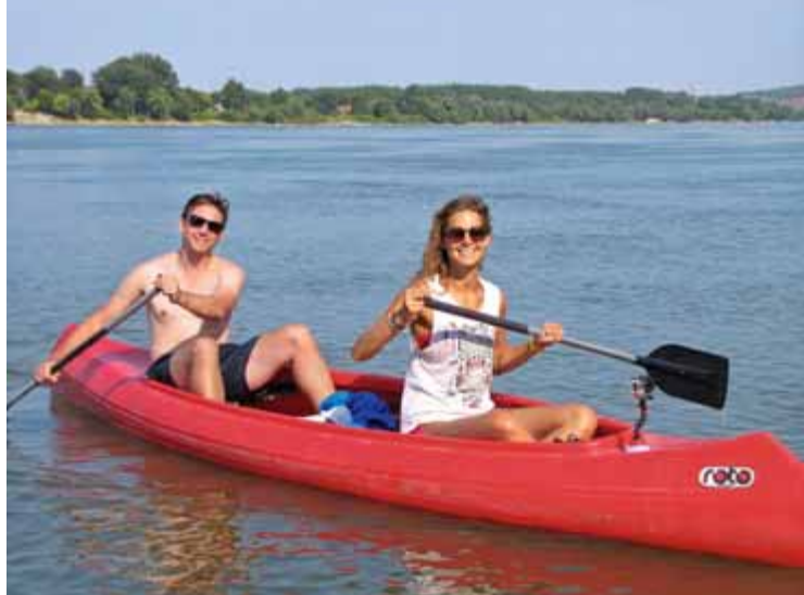
Straßencafés in der Fußgängerzone von Novi Sad (links). Eine Paddeltour auf der Donau bei Novi Sad bietet ungewöhnliche Blickwinkel auf Stadt und Natur