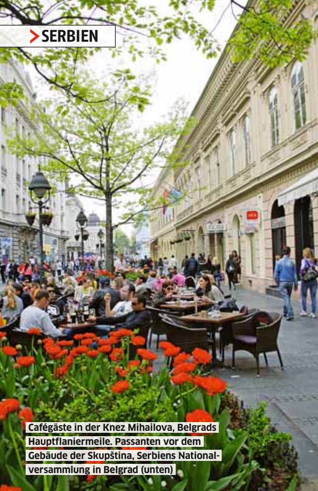
Cafégäste in der Knez Mihailova, Belgrads Hauptflaniermeile. Passanten vor dem Gebäude der Skupština, Serbiens Nationalversammlung in Belgrad (unten)