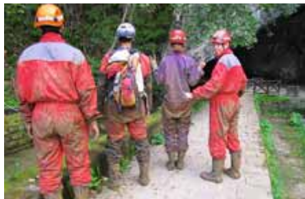
Beim Caving in Petnica geht es richtig zur Sache

Serbien ist von zahlreichen Höhlen durchlöchert – und die locken Abenteurer der Gegenwart an. Südöstlich der Stadt Valjevo, 90 km von Belgrad, wird in der Grotte von Petnica Abseilen (€ 35/Pers.) und Caving (€ 60/Pers.) angeboten