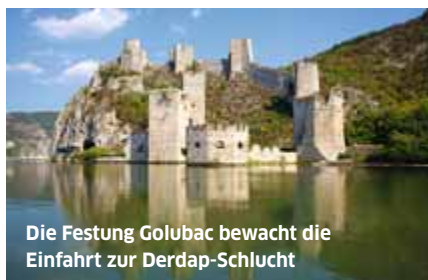
Die Festung Golubac bewacht die Einfahrt zur Derdap-Schlucht

In Serbiens Nordosten läuft eine Landstraße parallel zur Donau ostwärts. Sie führt Richtung Kladovo, durch den Nationalpark Derdap. Spektakulär wird es in der Derdap-Schlucht, deren Beginn die jahrhundertealte Festungsanlage Golubac markiert: Dort schnürt sich die Donau von der zuvor breitesten auf die nunmehr engste Stelle zusammen, überragt von majestätischen Felswänden. Rumänien liegt gegenüber in Sicht.