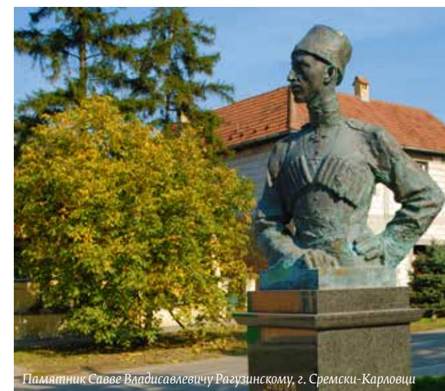
Памятник Савве Владисавлевичу Рагузинскому, г. Сремски-Карловци

...что в период между двумя мировыми войнами в г. Велики-Бечкерек (Зренянин) жил князь Шереметьев, внук императора Николая Первого, а в г. Нови-Сад – графиня София Толстая, открывшая при Сербской великой гимназии Русский швейную фабрику?