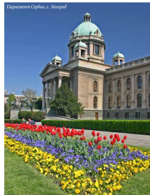
Парламент Сербии, г. Белград