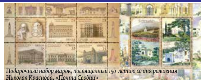
Подарочный набор марок, посвященный 150-летию со дня рождения Николая Краснова. «Почта Сербии»