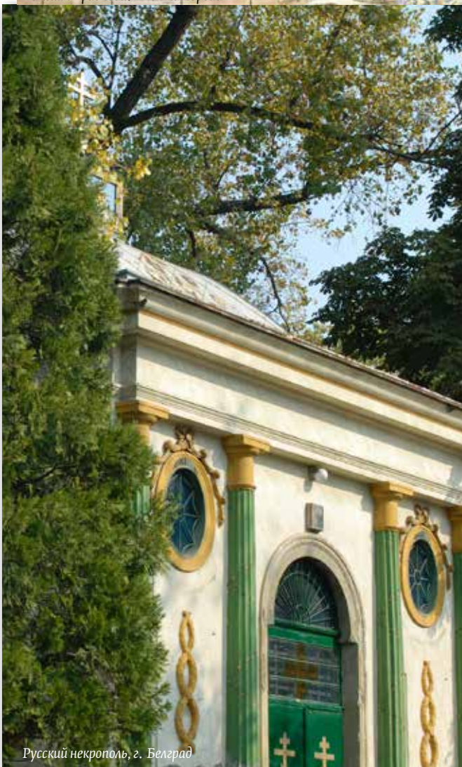
Русский некрополь, г. Белград

Русский некрополь находится в г. Белграде на ул. Рузвелтова.