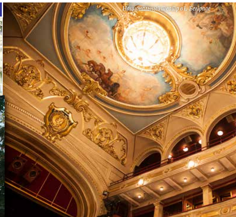
Национальный театр в г. Белграде