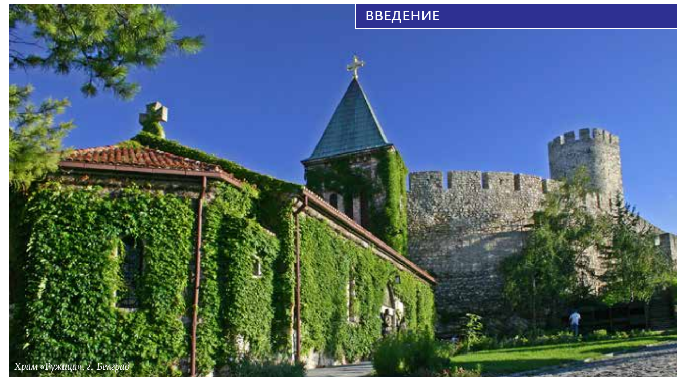
Храм «Ружица», г. Белград