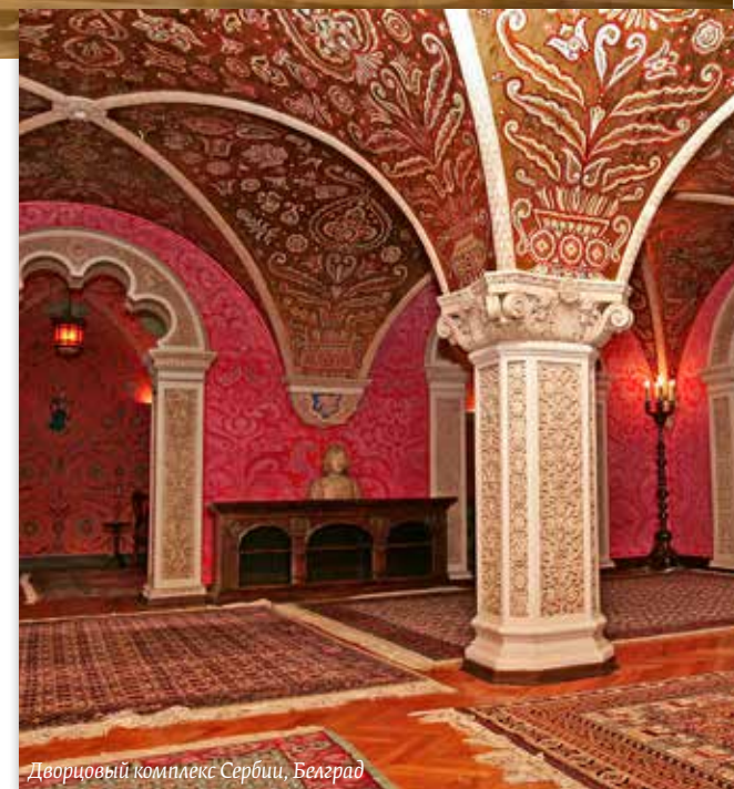
Дворцовый комплекс Сербии, Белград

... что правительство России пожертвовало 30 миллионов евро на роспись Храма святого Саввы Сербского?