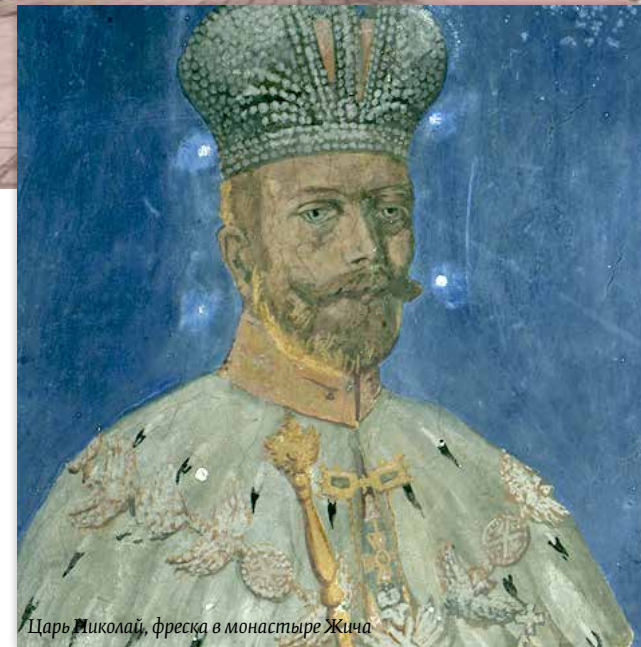
Царь Николай, фреска в монастыре Жича