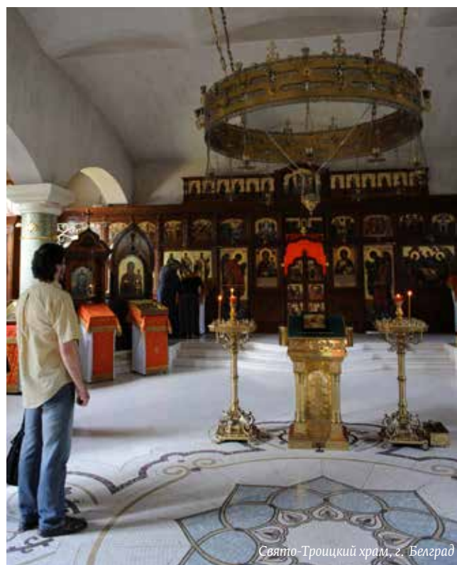
Свято-Троицкий храм, г. Белград