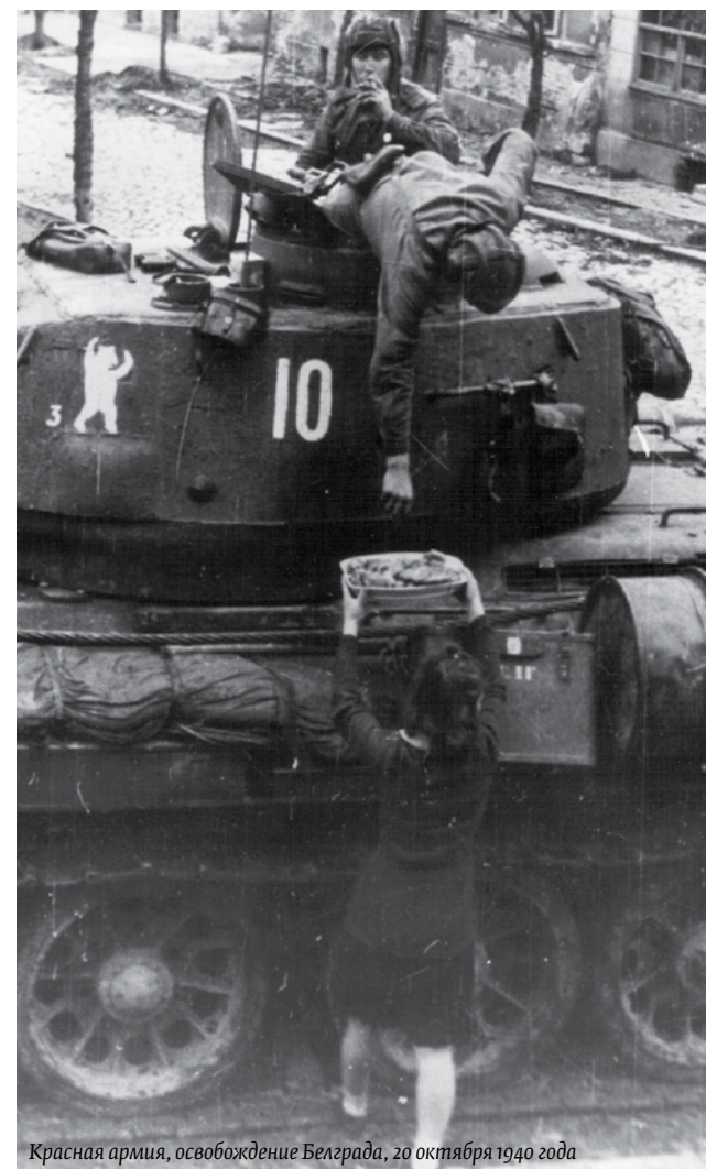
Красная армия, освобождение Белграда, 20 октября 1940 года

... что гостиница «Москва», открытая в 1908 году в присутствии короля Перта Первого, изначально называлась «Палата Россия», и там находилось страховое общество?