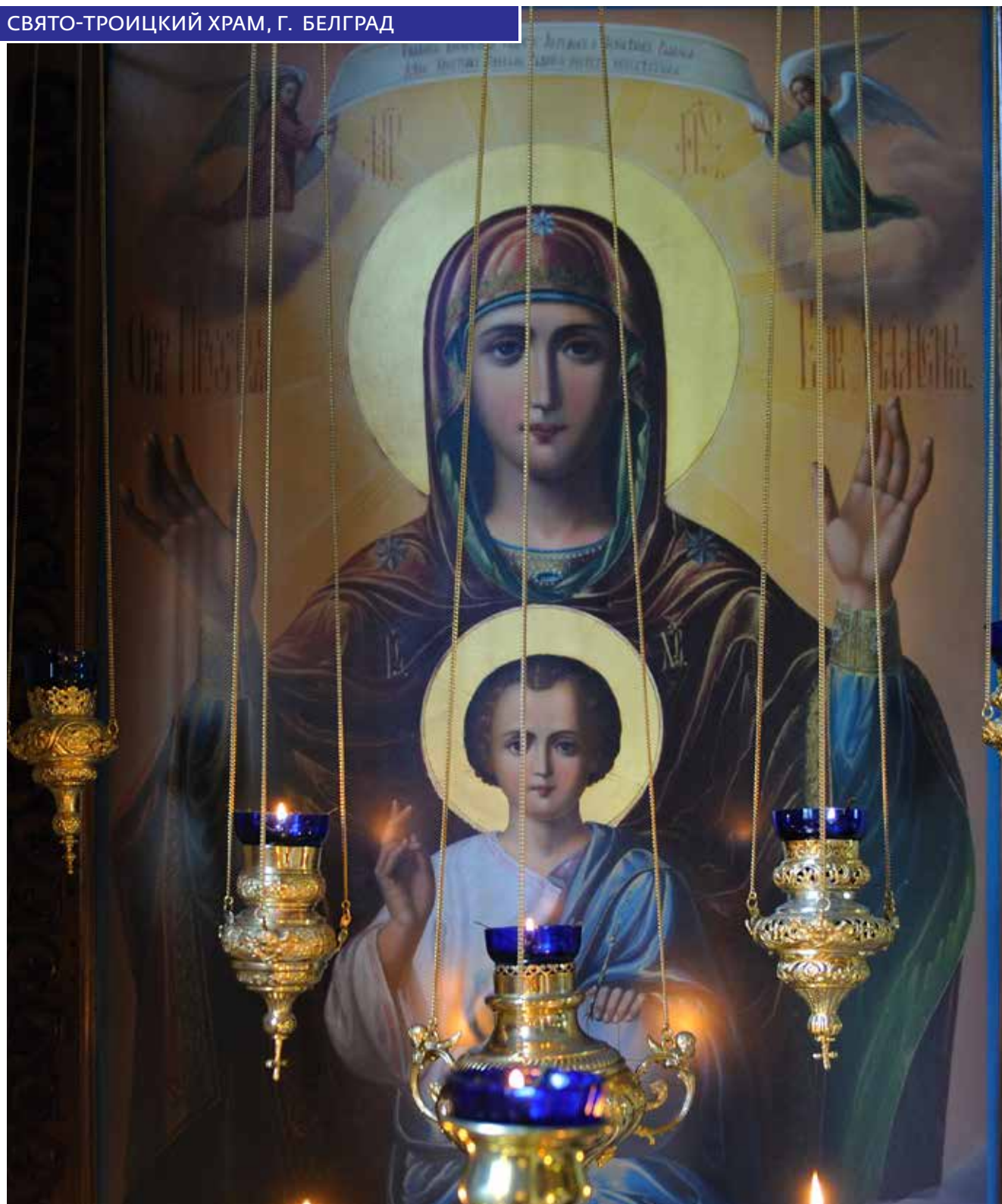
Главная страница: Белград, панорама