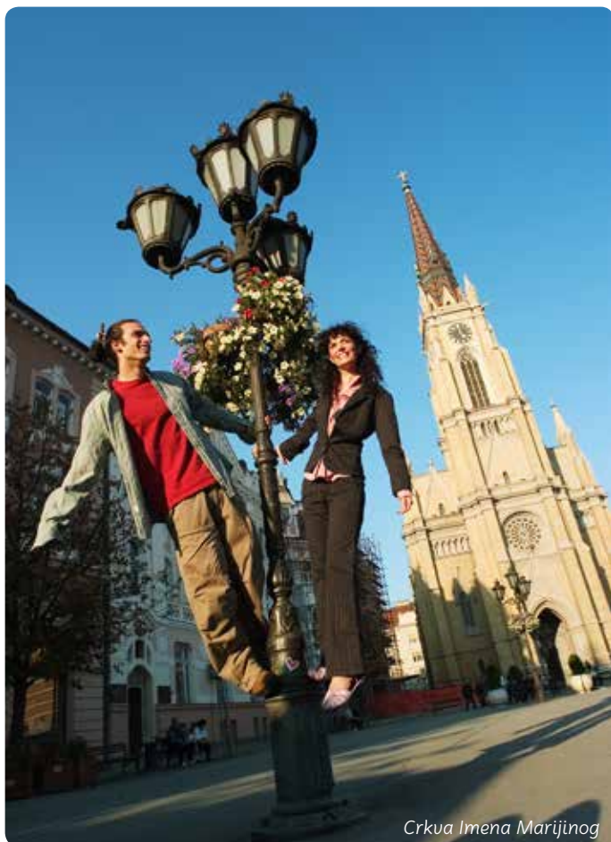
Crkva Imena Marijinog

Zmaj Jovina i Dunavska ulica, sa kućama i palatama raznobojnih fasada, mrežom bočnih ulica i pasaža, najslikovitiji je deo pešačke zone grada. Tu se nalazi raskošan Vladičanski dvor, Saborna crkva Sv. Đorđa i Zmaj Jovina gimnazija. Na Dunavsku ulicu nadovezuje se zeleno ostrvo grada – Dunavski park. Na samom obodu parka je izvanredna izložbena postavka Muzeja Vojvodine, a u blizini su i Muzej savremene umetnosti i Stalna prirodnjačka izložba.