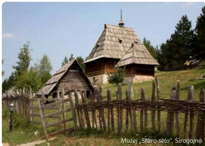
Muzej „Staro selo“, Sirogojno