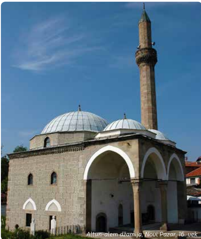
Altun-alem džamija, Novi Pazar, 16. vek