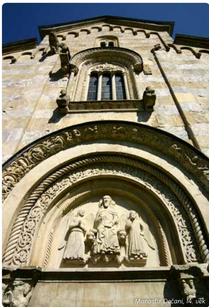
Manastir Dečani, 14. vek