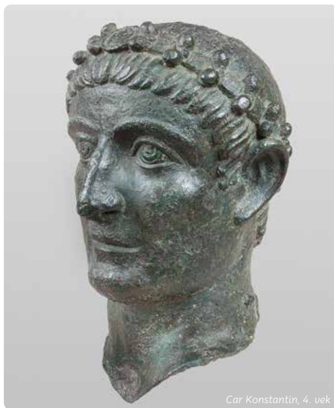
Car Konstantin, 4. vek