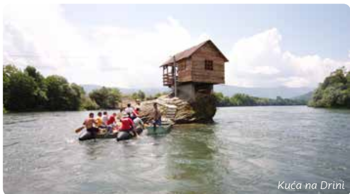
Kuća na Drini

Srbija, Crna Gora, Bosna i Hercegovina i Hrvatska nominovale su svoje srednjovekovne nekropole stećaka za listu svetske kulturne baštine. Reč je o jedinstvenom kulturnom fenomenu Balkana. Stećci na Perućcu i Rastištu kod Bajine Bašte predstavljaju deo ovog vrednog nasleđa.