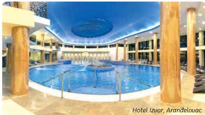
Hotel Izvor, Aranđelovac

Crkva Sv. Đorđa, mauzolej porodice Karađorđević, spolja je obložena belim mermerom, a unutrašnjost je prekrivena mozaicima najlepših srpskih srednjovekovnih fresaka. Ugrađeno je čak četrdeset miliona mozaičkih kockica u bezbroj nijansi. Grad rodonačelnika dinastije Karađorđević – Karađorđa Petrovića nalazi se u Topoli, u podnožju brega Oplenac.