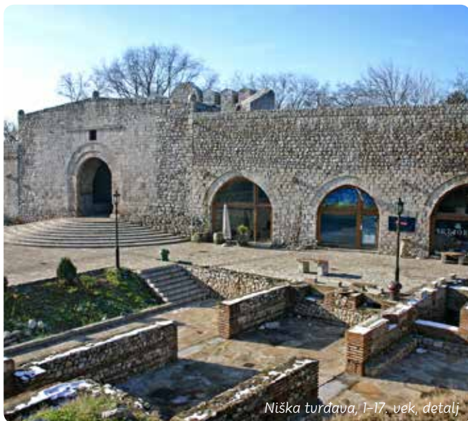
Niška tvrđava, 1-17. vek, detalj