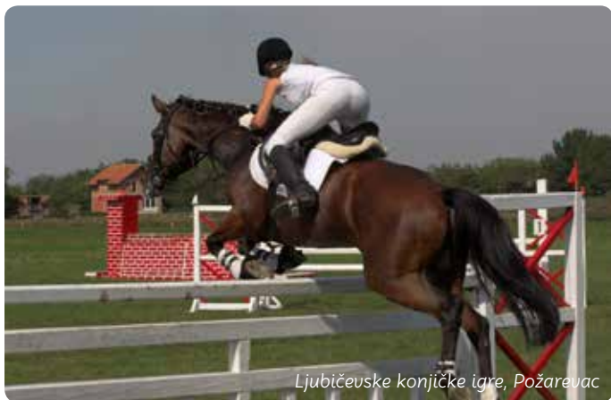
Ljubičevske konjičke igre, Požarevac