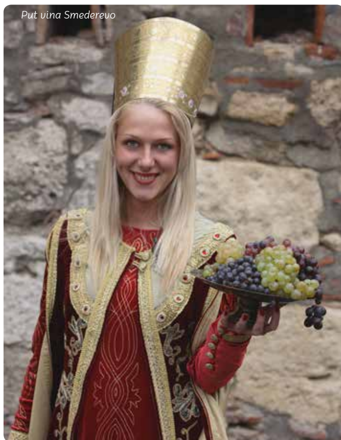
Put vina Smederevo

Mineralnu vodu sa Palanačkog kiseljaka pili su još stari Rimljani. Početak razvoja Kiseljaka vezuje se za kneza Miloša Obrenovića, koji 1834. godine piše svom lekaru da mu po surudžiji (poštaru) pošalje šest krčaga te vode. Flaširana voda sa ovog izvora danas se zove „Karadorđe“.