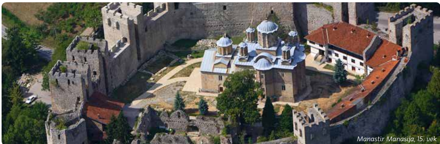
Manastir Manasija, 15. vek