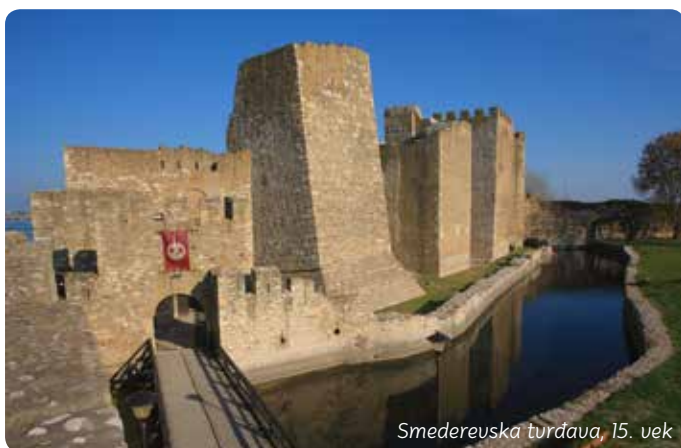
Smederevska tvrđava, 15. vek