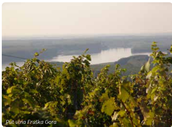
Put vina Fruška Gora