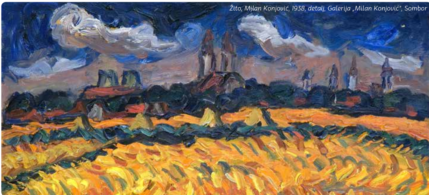
Žito, Milan Konjović, 1938, detalj, Galerija „Milan Konjović“, Sombor