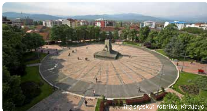
Trg srpskih ratnika, Kraljevo

Urbanistički zanimljiv grad sa centralnim trgom sa kojeg se zvezdasto šire ulice nastao je, kaže jedna priča, u tepsiji s peskom. Knez Miloš Obrenović je svojom rukom u pesku iscrtao plan današnjeg grada.