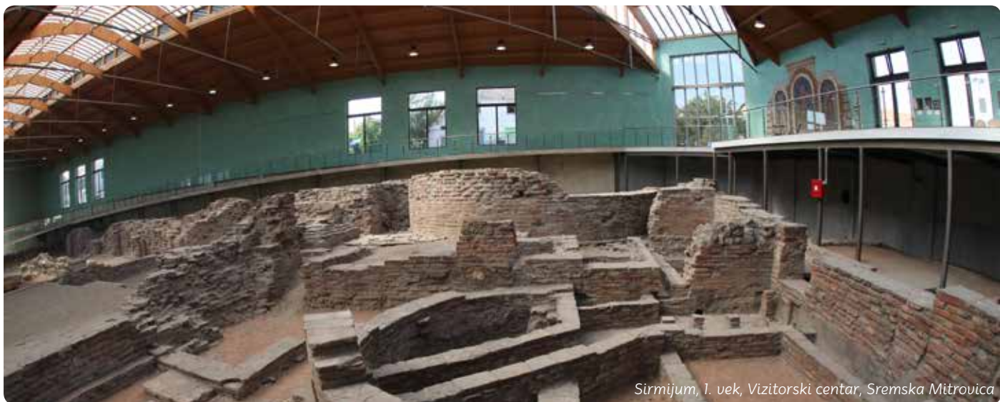
Sirmijum, 1. vek, Vizitorski centar, Sremska Mitrovica