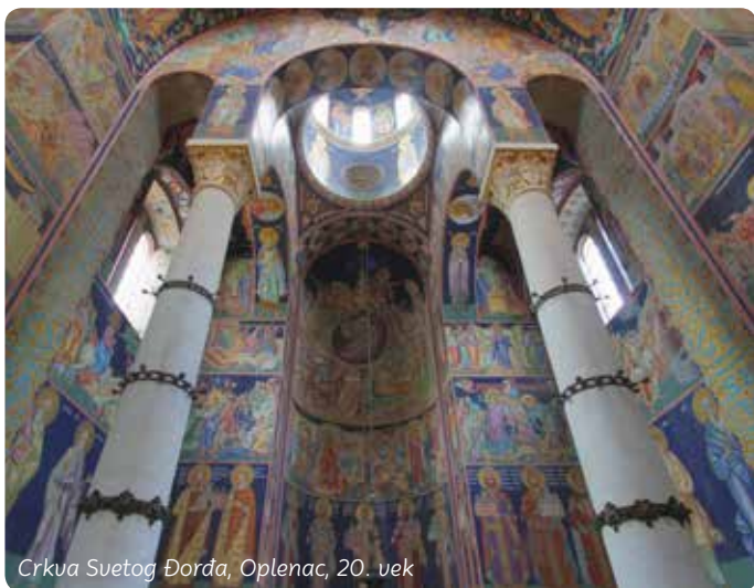
Crkva Svetog Đorđa, Oplenac, 20. vek