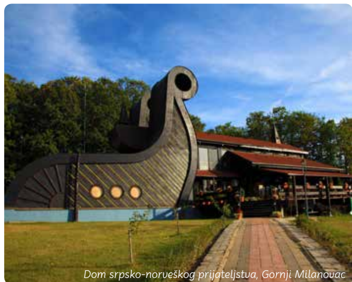
Dom srpsko-norveškog prijateljstva, Gornji Milanovac