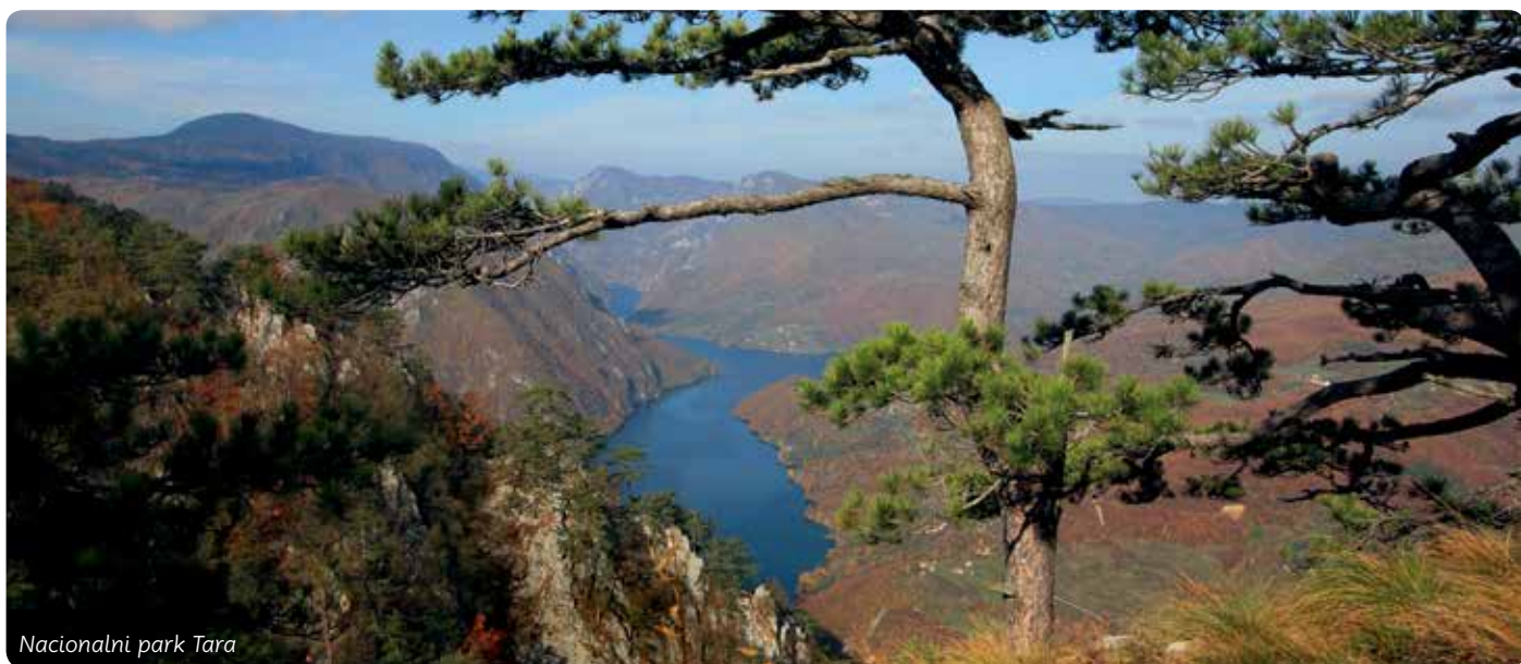
Nacionalni park Tara