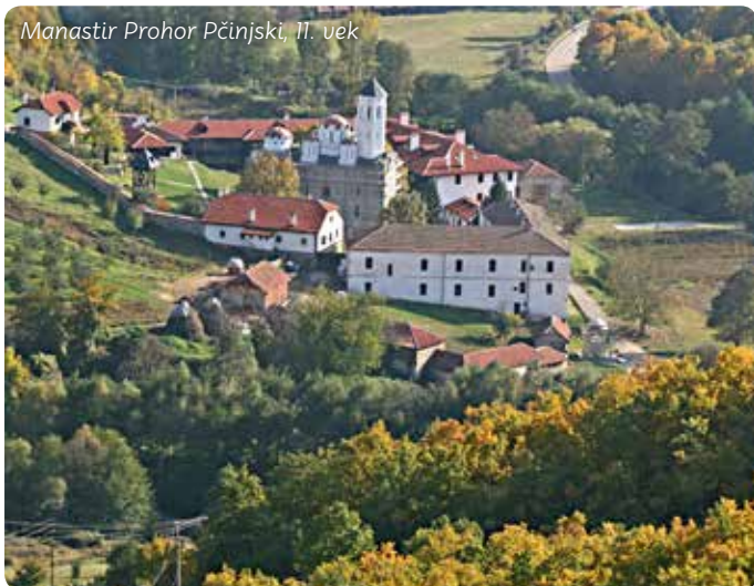
Manastir Prohor Pčinjski, 11. vek