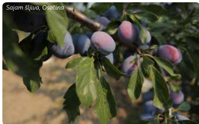
Sajam šljiva, Osečina