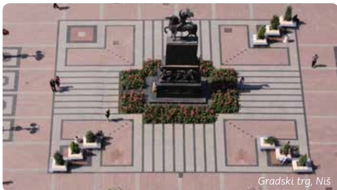
Grdski trg, Niš