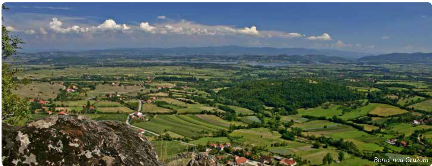
Borač nad Gružom