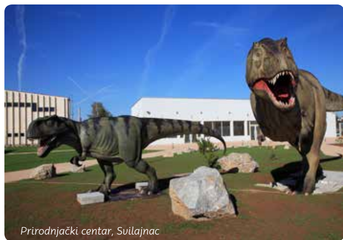
Prirodnjački centar, Svilajnac