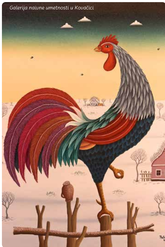
Galerija naive umetnosti u Kovačici

Fizičar svetskog glasa Mihajlo Pupin rođen je u Idvoru. Muzejski kompleks njemu posvećen sastoji se od tri celine: muzeja, rodne kuće i zadužbine.