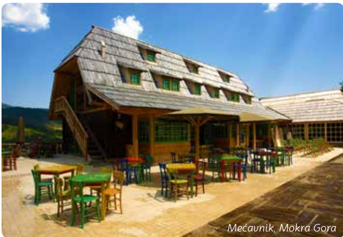
Mećavnik, Mokra Gora