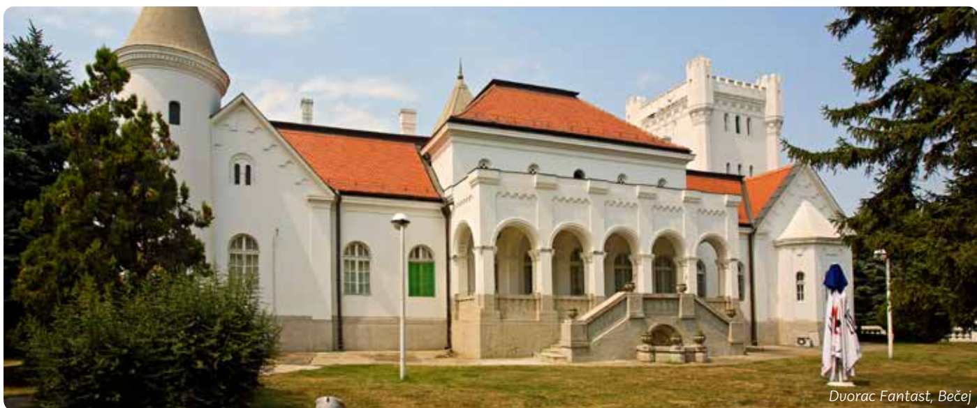
Dvorac Fantast, Bečej