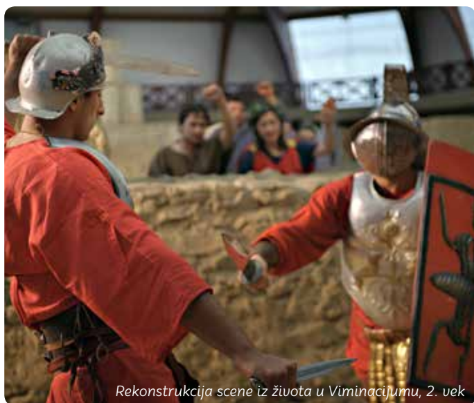
Rekonstrukcija scene iz života u Viminacijumu, 2. vek