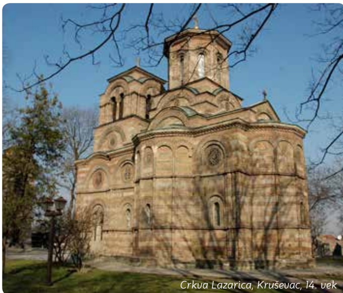
Crkva Lazarica, Kruševac, 14. vek