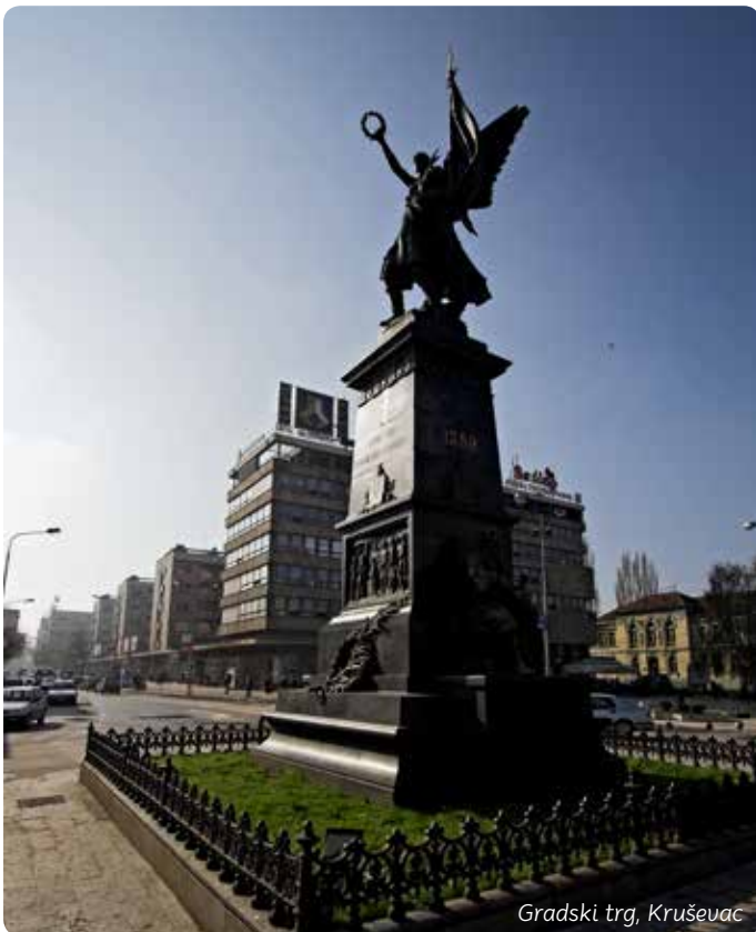
Gradski trg, Kruševac