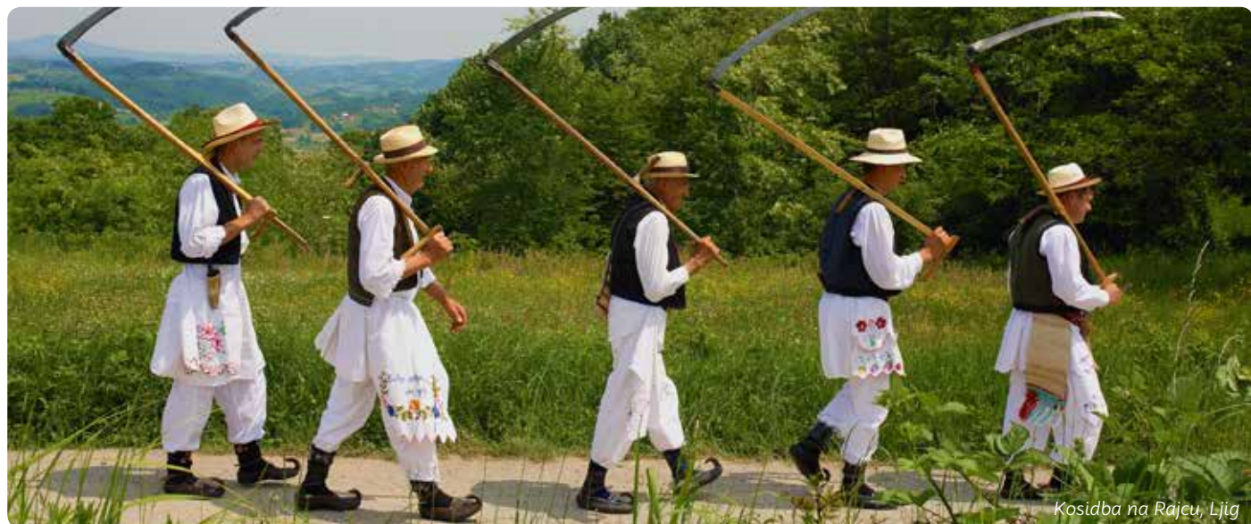
Kosidba na Rajcu, Ljig