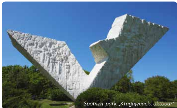
Spomen-park „Kragujevački oktobar“

Kragujevačka Zastava bila je najveća fabrika automobila u bivšoj Jugoslaviji. Godine 1955. proizvela je prvog „fiću“ – kultno nacionalno vozilo. Sa fabričkih traka izašlo je 923.487 simpatičnih malih automobila! Odnedavno u Kragujevcu se održava festival oldtajmera „Fića Fest“.