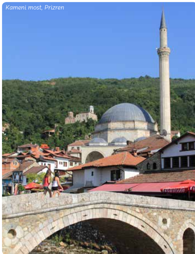
Kameni most, Prizren