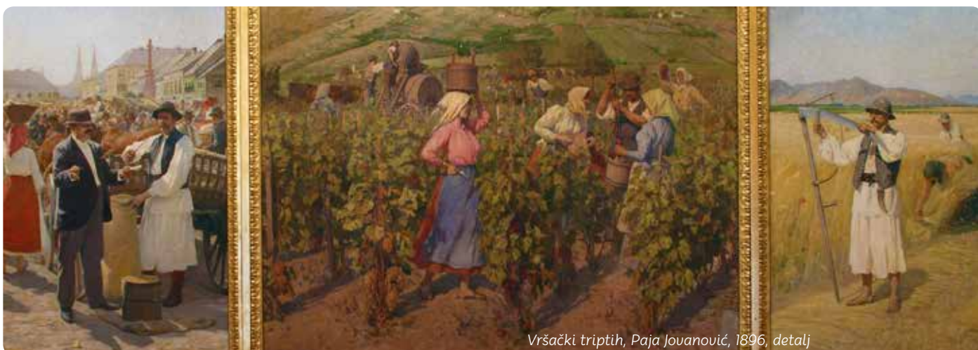
Vršački triptih, Paja Jovanović, 1896, detalj