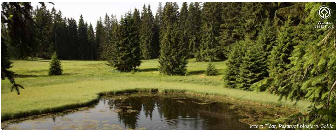
Jezero Tičar, Rezervat biosfere, Golija