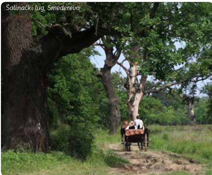
Šalinački lug, Smederevo