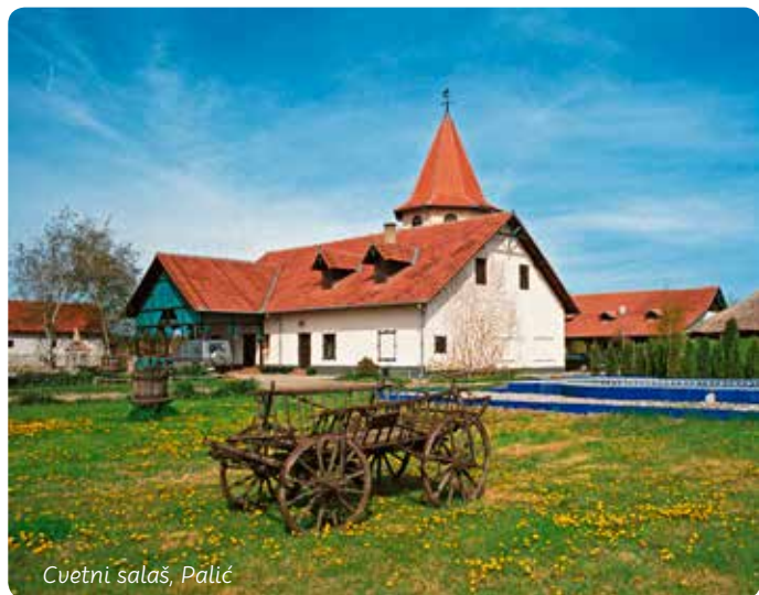
Cvetni salaš, Palić

Banja Kanjiža nastala je zahvaljujući pastirima koji su, kopajući bunar, slučajno otkrili vrelu lekovitu vodu. Ta banja je danas moderan centar za rehabilitaciju i rekreaciju.