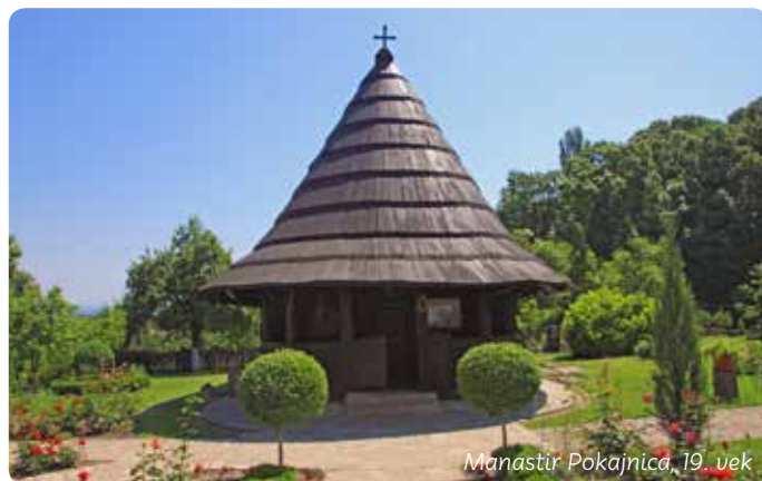
Manastir Pokajnica, 19. vek