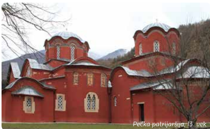
Pečka patrijaršija, 13. vek