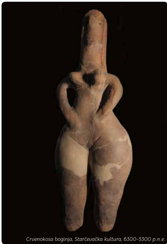
Crvenokosa boginja, Starčevačka kultura, 6300–5300 p.n.e.