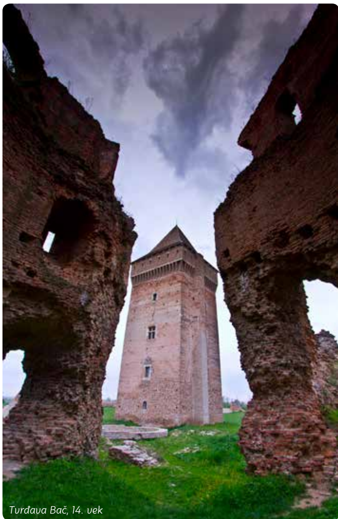
Turdava Bač, 14. vek