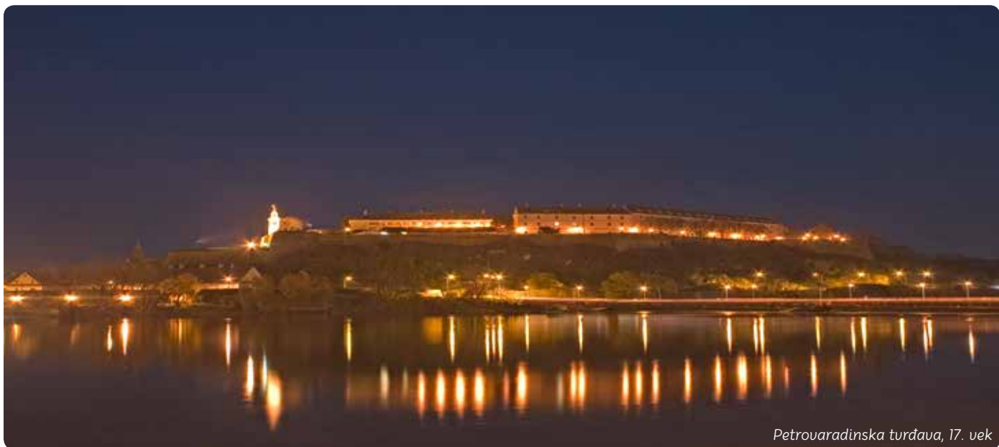
Petrovaradinska tvrđava, 17. vek

U srpskom jeziku sinonimi za reč sâd su: vrt, bašta i cvetna leja. Jedan od prvih utisaka koji grad ostavlja je slika negovane lepote. Njegovu arhitekturu i duh oblikovale su mnoge nacije. Ležeran, okružen plodnom ravnicom, Fruškom gorom i Dunavom, glavni grad Vojvodine je biser među gradovima Srbije. Nosi nazive Srpska Atina, Gibraltar na Dunavu i svetska prestonica mladih poklonika EXIT festivala.