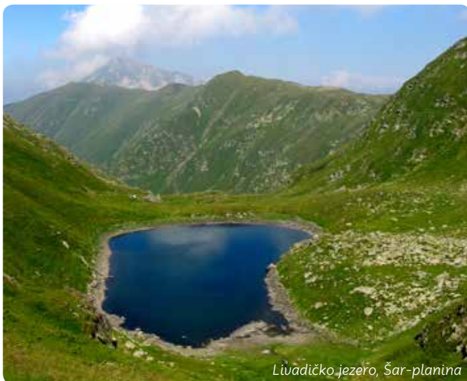
Livadičko jezero, Šar-planina