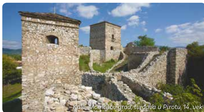
Kale, Momčilov grad, tvrđava u Pirotu, 14. vek