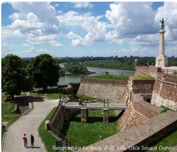
Beogradska tvrđava, 2-18. vek, Ušće Save u Dunav