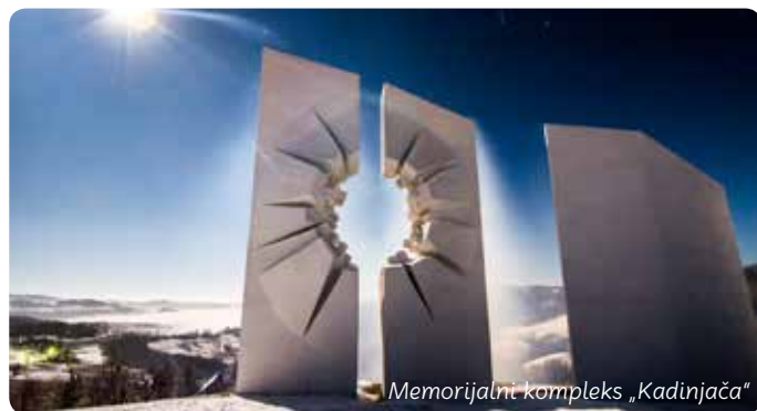
Memorijalni kompleks „Kadinjača“

Grnčari iz sela Zlakuse primenjuju veoma staru i jedinstvenu tehniku: oblikuju predmete na sporom ručnom kolu i peku ih na otvorenoj vatri. Lonci, đuvečare, sačevi... izrađuju se od posebne gline, koja se meša sa mlevenim kalcitom. Hrana spremljena u zlakuskim posudama izuzetnog je ukusa.