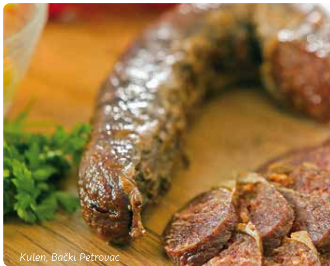
Kulen, Bački Petrovac