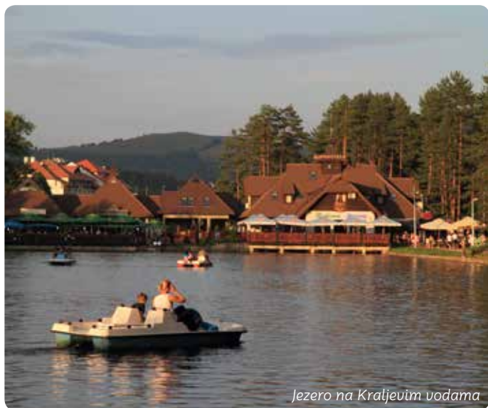
Jezero na Kraljevim vodama