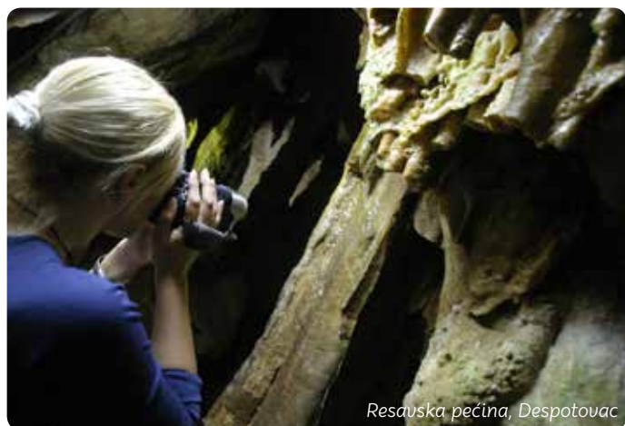
Resavska pećina, Despotovac

Paraćin je Balkanska prestonica stakla. „Duvački orkestar“ Srpske fabrike stakla u svetu je poznat po svojim unikatnim proizvodima i tajni izrade dvoslojnog kristala sa poludragim kamenjem.