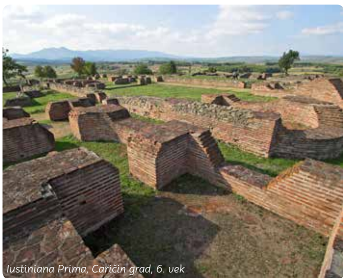
Justiniana Prima, Caričin grad, 6. vek