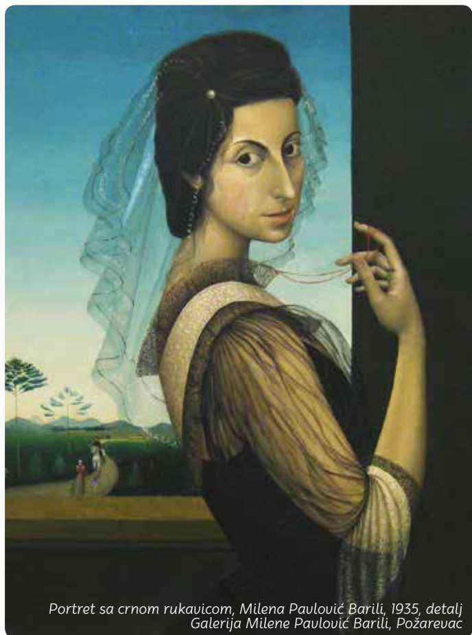
Portret sa crnom rukavicom, Milena Pavlović Barili, 1935, detalj Galerija Milene Pavlović Barili, Požarevac

Velika srpska slikarka Milena Pavlović Barili u jednom pismu majci sažela je svoju poetku: „U mojoj mašti su se sjedinile naše priče o vilama brodaricama, koje si mi ti kazivala, sa pesmama Valerija, a polomljene rimske skulpture i sarkofazi, koje sam sa oduševljenjem i divljenjem gledala u arheološkim nalazištima kod Požarevca, vodili su me do vizija Botičelija i De Kirika.“ U Mileninoj rodnoj kući u Požarevcu izložena je njena dragocena ostavština.