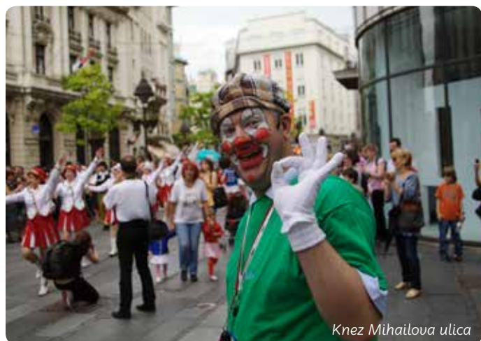
Knez Mihailova ulica