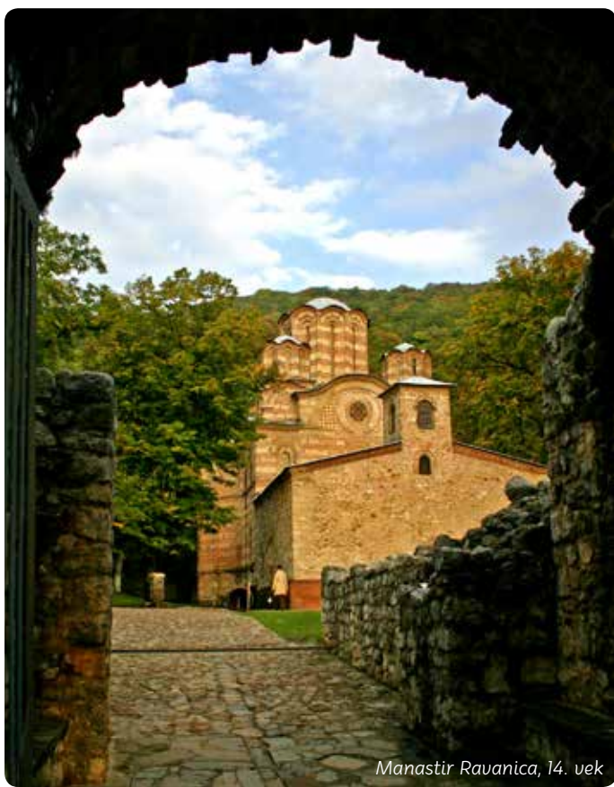
Manastir Ravanica, 14. vek