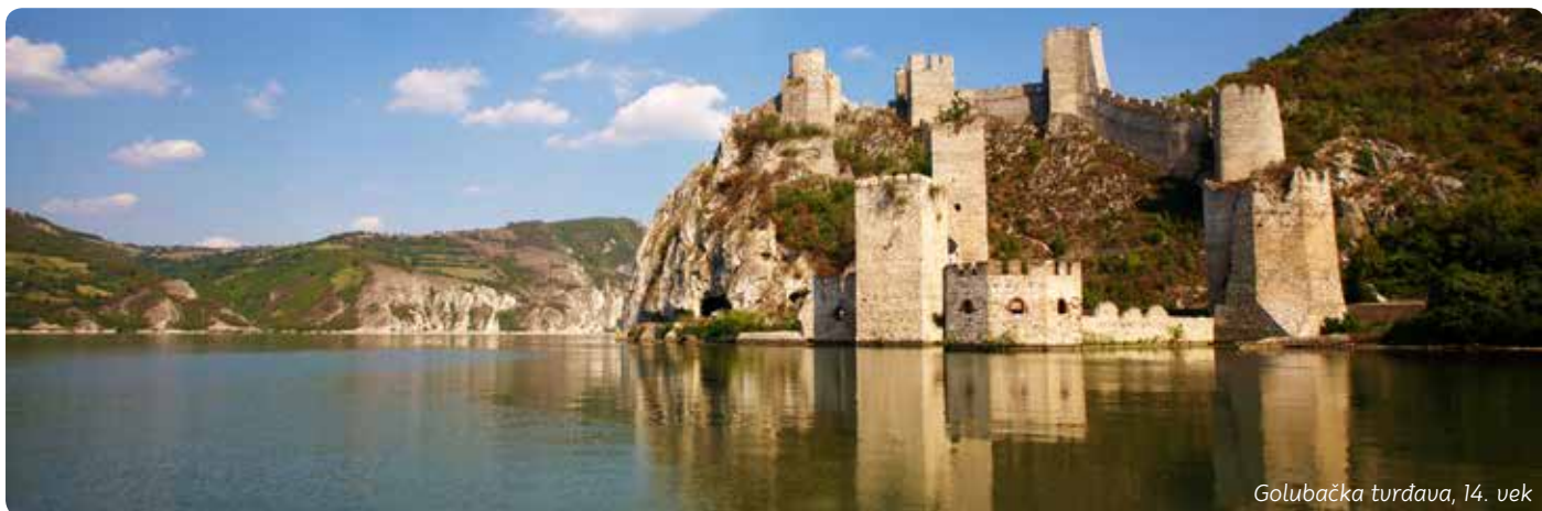
Golubačka tvrđava, 14. vek