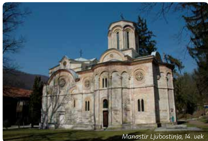
Manastir Ljubostinja, 14. vek