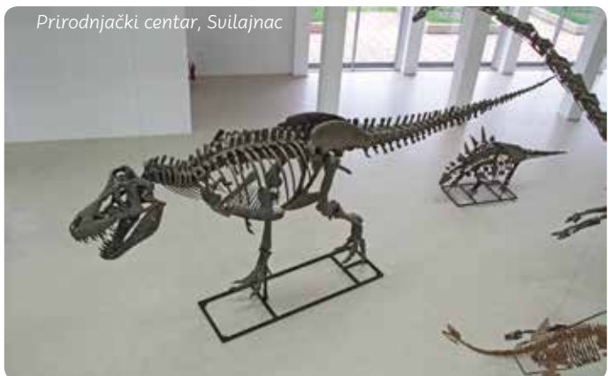
Prirodnjački centar, Svilajnac