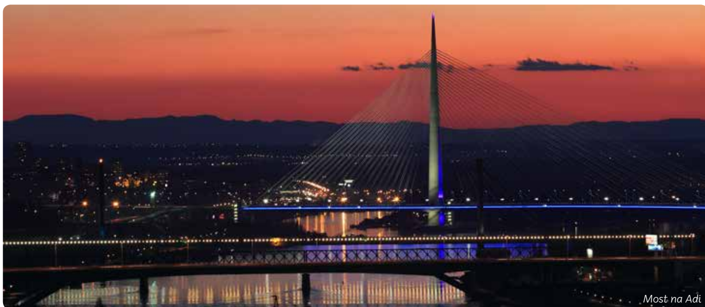
Most na Adi

Glavni grad Srbije kaplja je između Istoka i Zapada. On je topionica raznolikih kultura koja je proizvela jedan osobit duh otvorenosti i kosmopolitizma. Jedinstveni pečat daju mu dve velike reke – Sava i Dunav, obilje kulturnih dešavanja i mesta za izlazak. Grad ima mnogo zanimljivih ambijenata i sadrži čitavu riznicu lepota u muzejima, crkvama, ulicama, parkovima... Uzbudljiv i dinamičan, Beograd je snažan i neodoljivi urbani magnet.