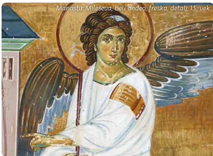
Manastir Mileševa, Beli anđeo, freska, detalj, 13. vek