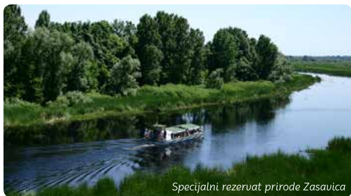
Specijalni rezervat prirode Zasavica

Preplitanjem tokova Save i Drine nastala je Zasavica, danas specijalni rezervat prirode. Zasavica je carstvo ptica močvarica i starih rasa domaćih životinja. Zaštitni znak rezervata je retka riba umbra, poznata kao „pas koji pliva“. Vizitorski centar ima toranj sa pogledom na najlepši deo reke.