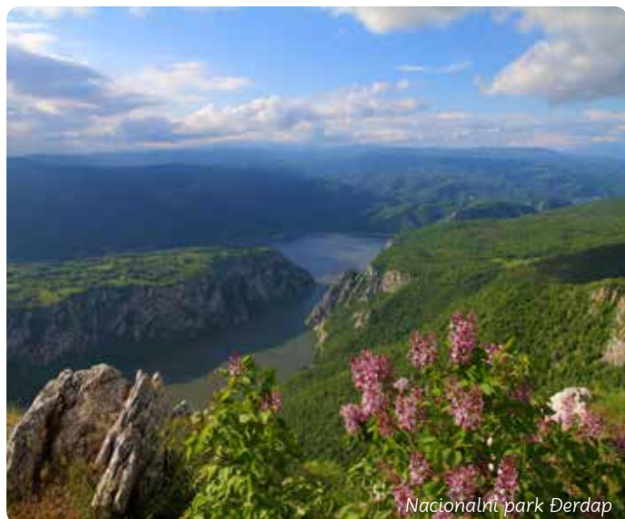
Nacionalni park Đerdap

Proslavljeni istraživač podvodnog sveta Žak Kusto merio je ponore Đerdapa – na mestu Gospodin vir rečno dno se nalazi na dubini od 90 metara! Đerdapska klisura nije samo najdublja već je i najveća rečna probojnica Starog kontinenta. Rimljani su joj dali ime Gvozdena vrata. Današnji naziv Đerdap ima koren u staroperzijskoj reči girdap, koja znači vrtlog, vir.