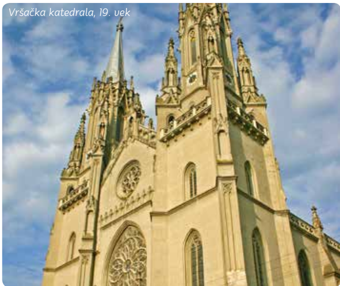
Vršačka katedrala, 19. vek