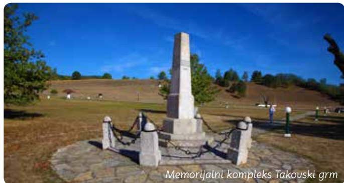
Memorijalni kompleks Takovski grm