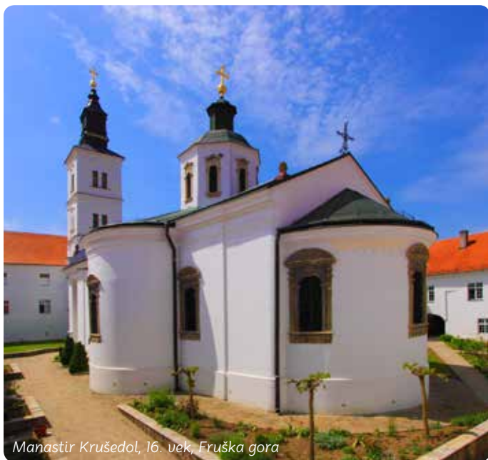
Manastir Krušedoł, 16. vek, Fruška gora