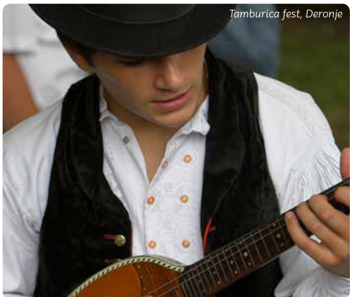
Tamburica fest, Deronje

U Kuli su još početkom 19. veka postojali cehovi krojača, obućara, tkača... Varošica je dugo bila poznata po fabrici šešira, a najdužu tradiciju ima fabrika šećera.