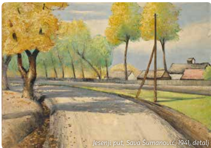
Jesenji put, Sava Šumanović, 1941, detalj