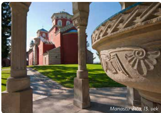
Manastir Žiča, 13. vek