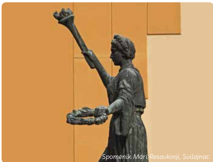
Spomenik Mari Resavkinji, Svilajnac

Istina i legenda o podvizima devojke Mare su tokom vekova preasle u kult Resavske oblasti. Spomenik Mari Resavkinji podignut je 1926. godine u čast palim ratnicima varoši Svilajnac u borbama 1912-1918. godine.