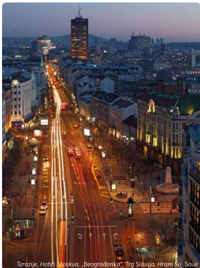
Terazije, Hotel Moskva, „Beogradanka“, Trg Slavija, Hram Sv. Save