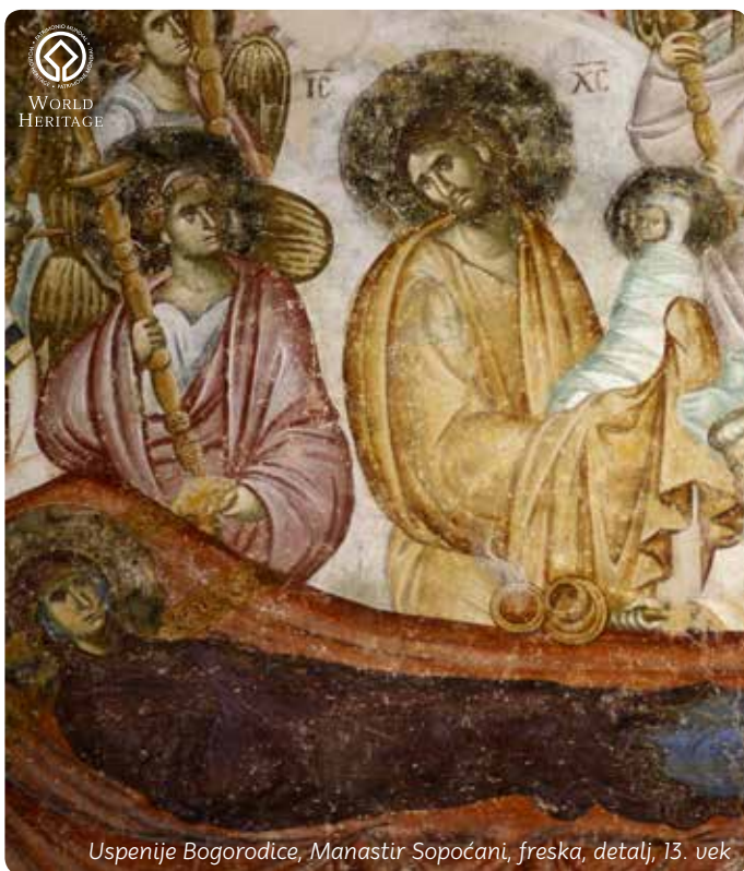
Uspenije Bogorodice, Manastir Sopoćani, freska, detalj, 13. vek