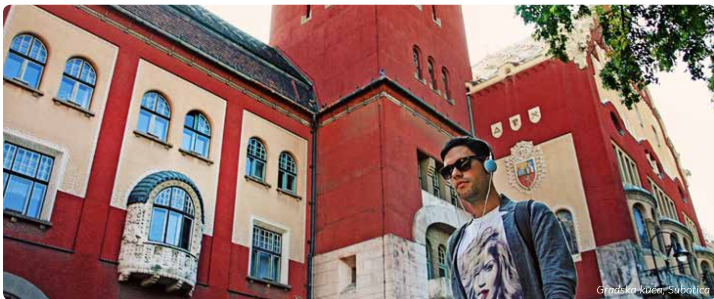
Gradiska kuća, Subotica