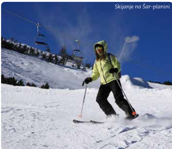
Skijanje na Šar-planini