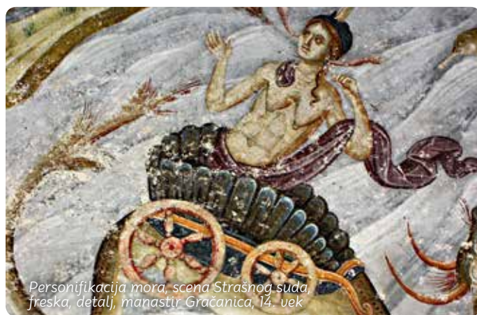
Personifikacija mora, scena Strašnog suda, freska, detalj, manastir Gračanica, 14. vek

Visoke Dečane (14. vek) podigli su kralj Stefan Uroš Treći Dečanski i njegov sin car Dušan. Hram je posvećen Vaznesenju Gospodnjem. Prema dimenzijama, Dečani su najveća sakralna građevina srednjovekovne Srbije. Crkva je ukrašena raskošnom kamenom plastikom i živopisom sa više od hiljadu figura i scena. U Uneskovom obrazloženju piše da su Dečani „građevina koja integriše vizantijsku tradiciju Istoka sa srednjovekovnom tradicijom Zapada“.