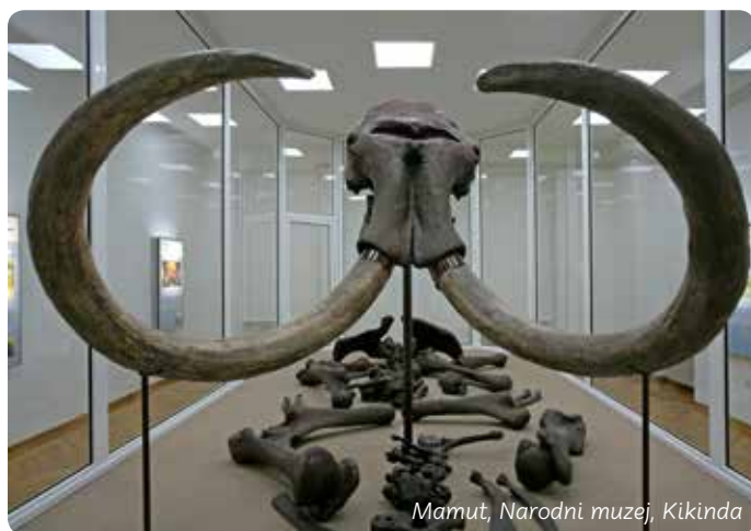
Mamut, Narodni muzej, Kikinda

Arhivi svedoče da je bečki dvor koristio isključivo kikindsko brašno. Etiketa „Danfila“ iz 1885. godine ima pet zlatnih medalja sa svetskih sajmova. Izvanredna glina „dovela“ je u Kikindu Internacionalni vajarski simpozijum „Terra“. Danas postoji zbirka veća od 1.500 skulptura u terakoti.