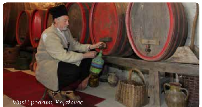
Vinski podrum, Knjaževac