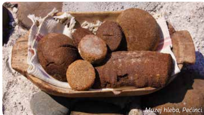
Muzej hleba, Pećinci