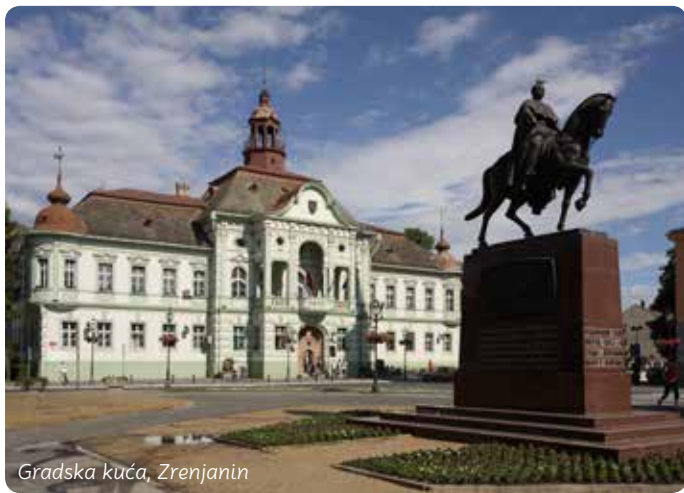
Gradska kuća, Zrenjanin