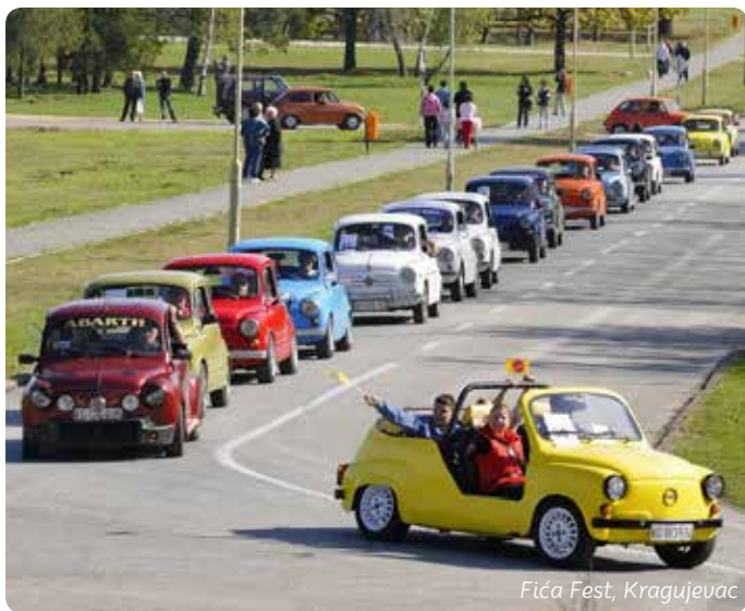
Fića Fest, Kragujevac