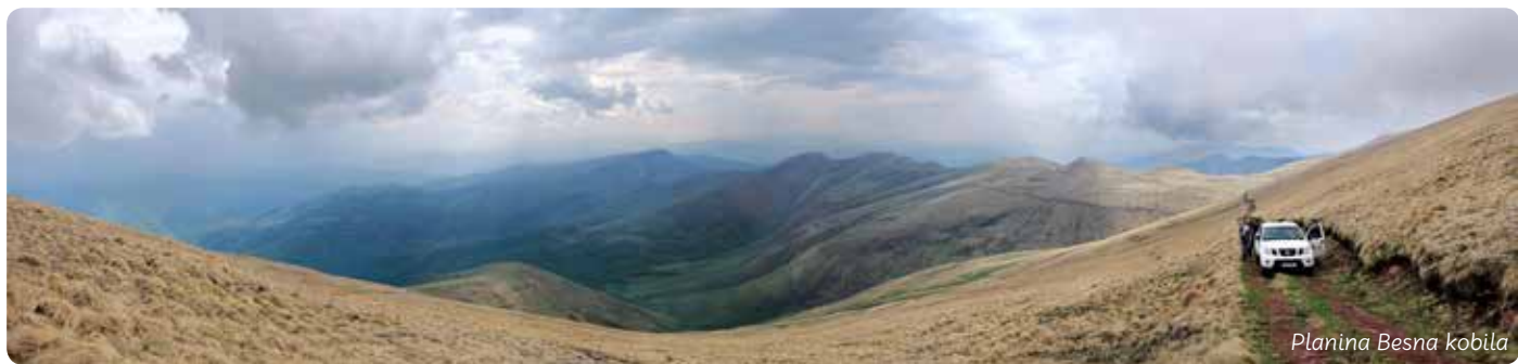
Planina Besna kobila