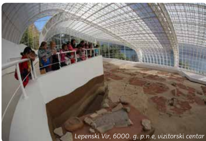
Lepenski Vir, 6000. g. p. n. e, vizitorski centar