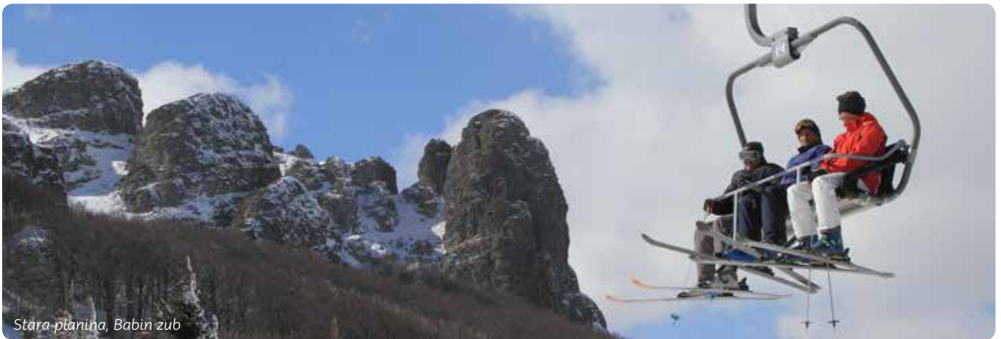
Stara planina, Babin zub

VINOGRORJE NA TIMOKU I ČUDESNA STARA PLANINA