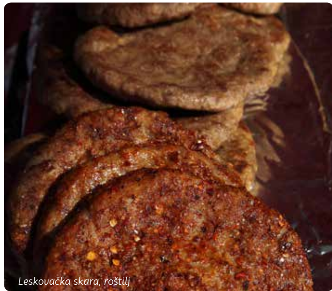
Leskovačka skara, roštilj