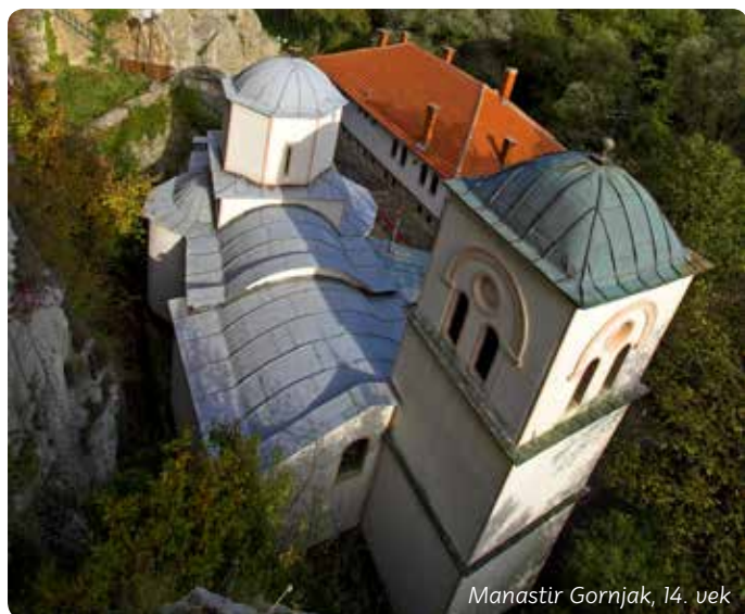
Manastir Gornjak, 14. vek