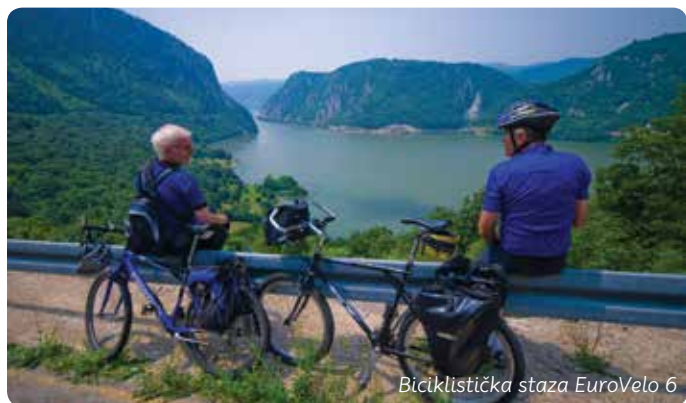
Biciklistička staza EuroVelo 6

U Brnjici kod Golupca u četvrtak, i u Neresnici u nedelju posle Duhova, slave se takozvane Male rusaljke – Rusalje miš. Vlasi su Balkan naseljavali pre svih drugih naroda, a u ove krajeve doneli su verovanje u rusaljke – mlade devojke koje u noćima mladog meseca igraju na proplancima.