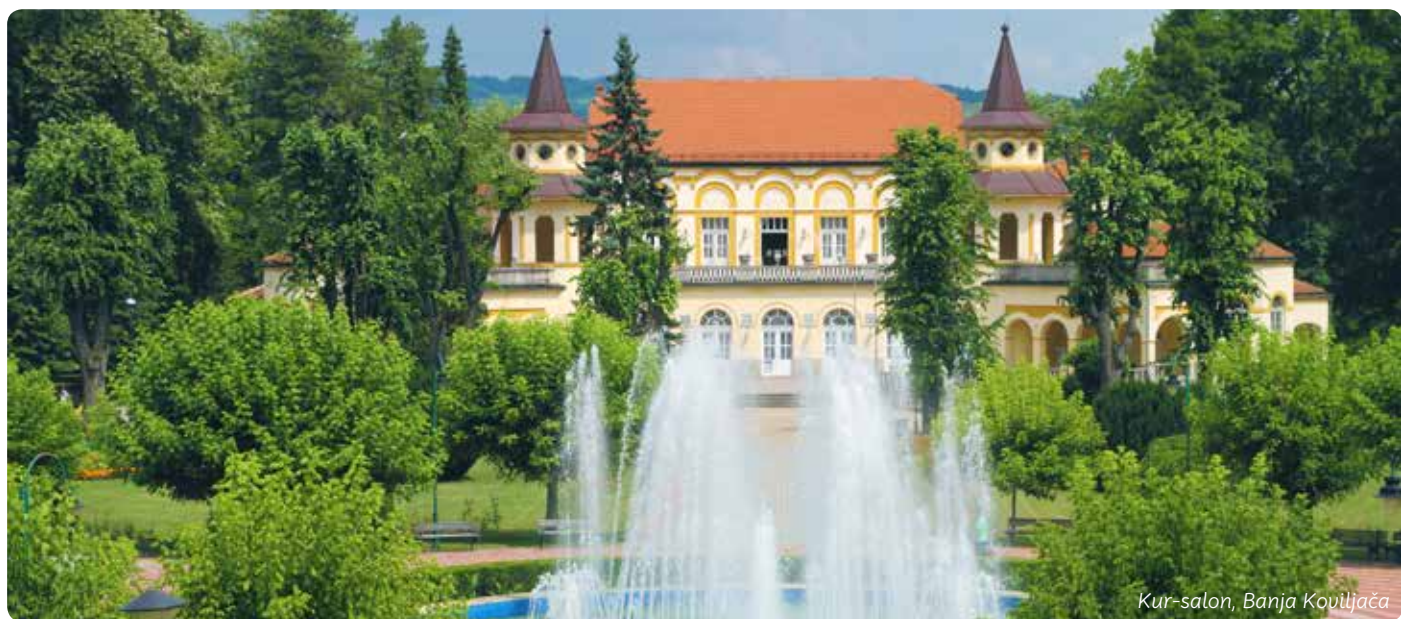
Kur-salon, Banja Koviljača