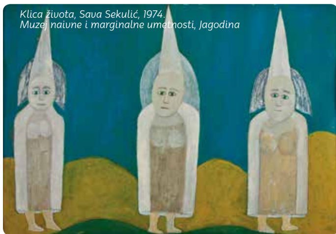
Klica života, Sava Sekulić, 1974. Muzej naivne i marginalne umetnosti, Jagodina