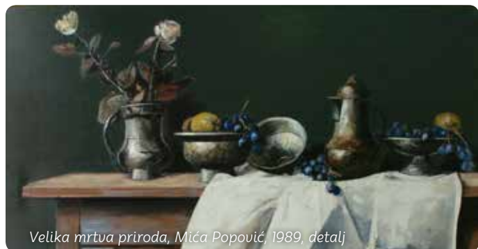
Velika mrtva priroda, Mića Popović, 1989, detalj

U lepom mačvanskom selu Lipolist cveta milion sadnica ruža! U junu, kada se održava Festival u čast „kraljice cveća“, u Lipolistu se rascvetavaju i hiljade stabala lipe.