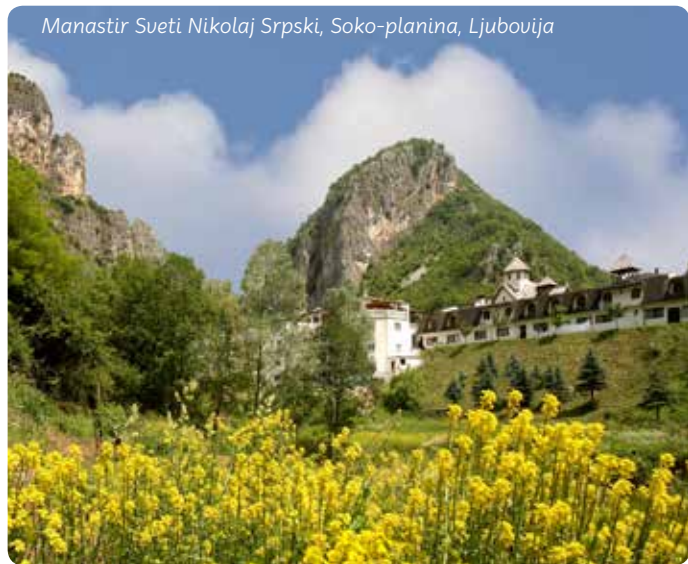
Manastir Sueti Nikolaj Srpski, Soko-planina, Ljubovija

Crkva Sv. Vaznesenja u Krupnju i spomen-kosturnica na Mačkovom kamenu deo su istog memorijalnog kompleksa podignutog u znak sećanja na veliku bitku Prvog svetskog rata. Zanimljivo je da je crkveni polijelej urađen od metaka, bajoneta, sablji i granata sakupljenih sa bojišta.