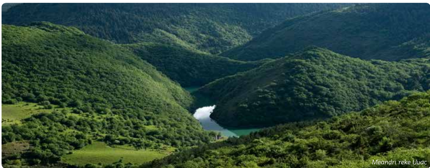
Meandri reke Uvca