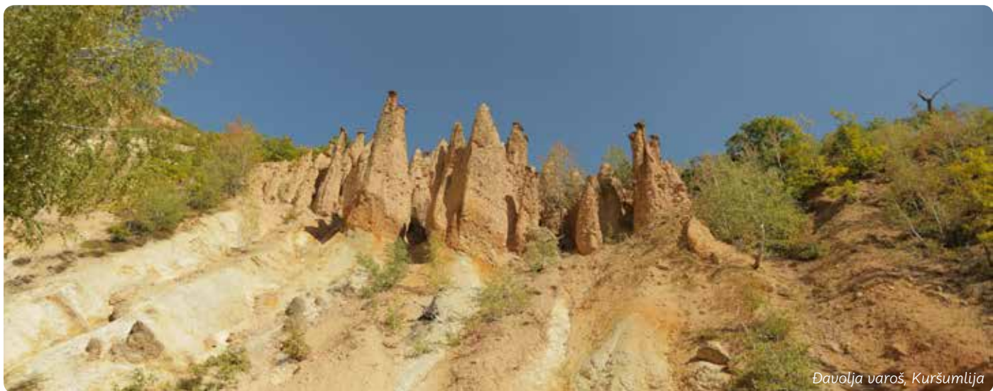
Đavolja varoš, Kuršumlija

U SVETU LEKOVITIH VODA I ČUDESNIH POJAVA