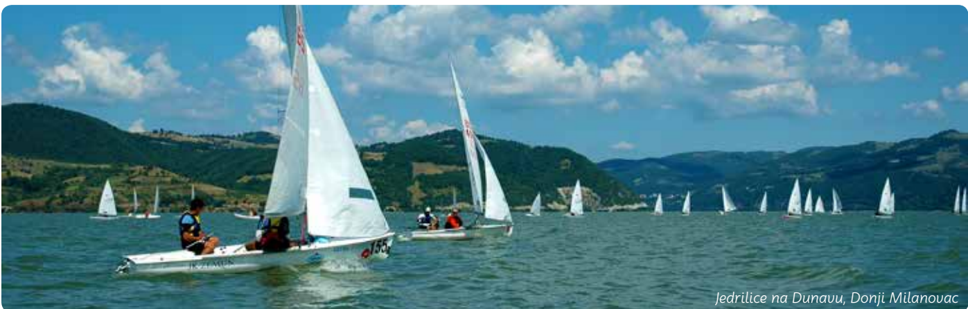
Jedrilice na Dunavu, Donji Milanovac

Granični rimski put, mukotrпно probijan kroz bespuća klisure, potopila je brana hidroelektrane. Danas o tom poduhvatu svedoči čuvena tabla imperatora Trajana. Tu je nastalo i jedno od remek-dela čuvenog arhitekta Apolodara iz Damaska – kameni most preko Dunava, za koji istoričari kažu da je „hiljadu godina bio najduži most na svetu“.