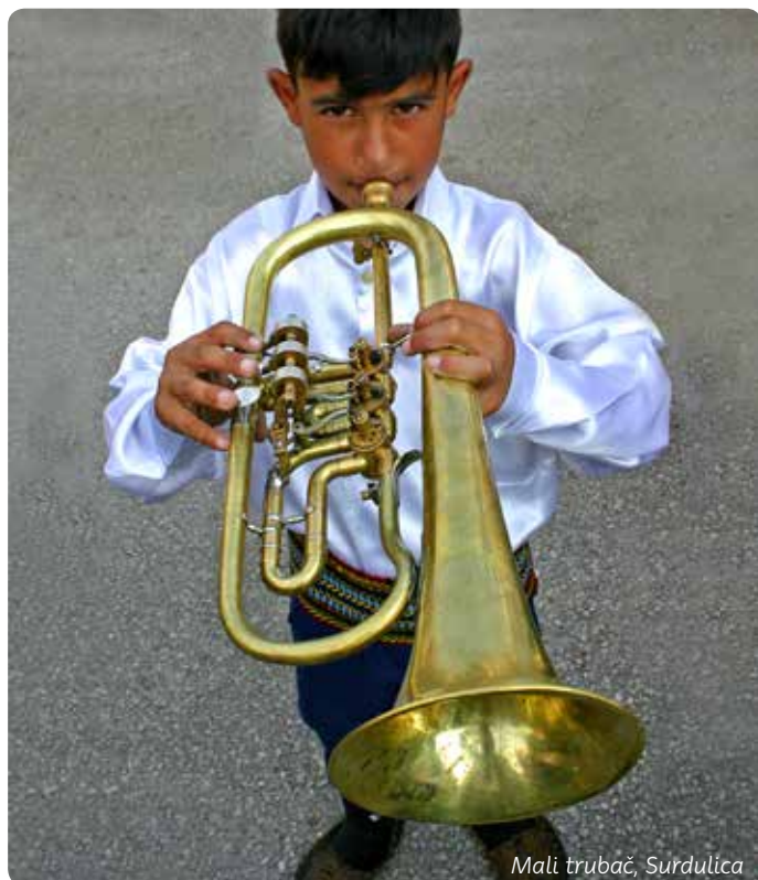
Mali trubač, Surdulica