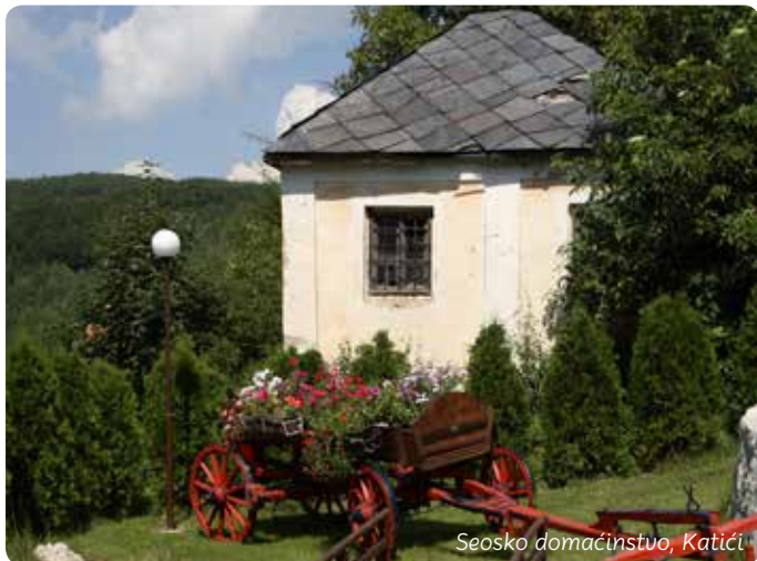
Seosko domaćinstvo, Katići