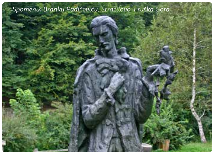
Spomenik Branku Radičeviću, Stražilovo, Fruška Gora

Etno-kuća u Maradiku stara je oko 150 godina. Posetioци će se razgledajući autentičnu etno-zbirku upoznati sa životom u tom delu Srema.