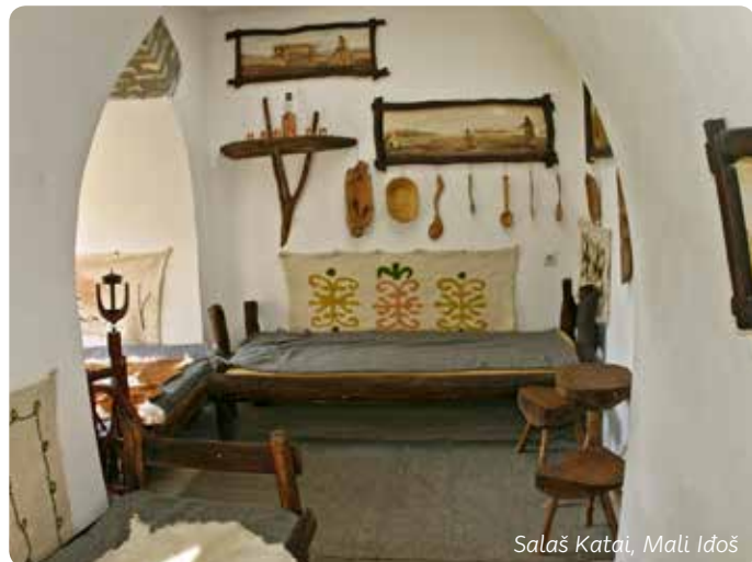
Salaš Katai, Mali Idoš