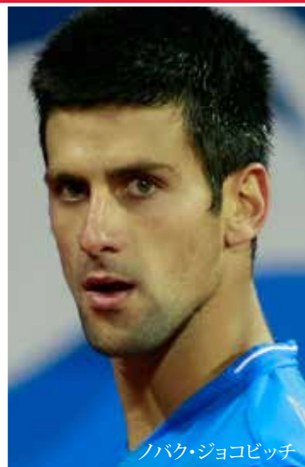
ノバク・ジョコビッチ