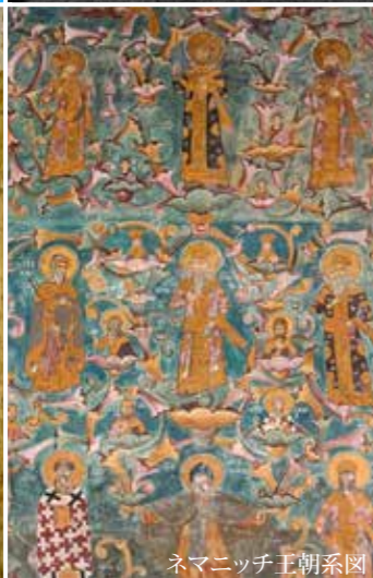
ネマニッチ王朝系図