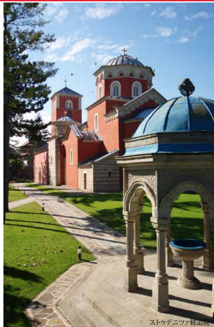
ストゥデニツァ修道院

多様な建築、彫刻装飾、フレスコ壁画、聖像、写本、工芸品など、中世セルビアの教会と修道院は、セルビアにとって重要な歴史文化遺産です。