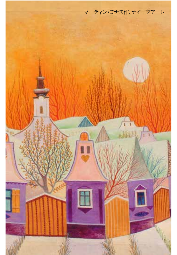
マーティン・ヨナス作、ナイーブアート

オブレナツの聖ジョルジェ教会 www.mgb.org.rs ベオグラード市立博物館 www.zasavica.org.rs ザサビツァ自然保護区 www.oplenac.rs