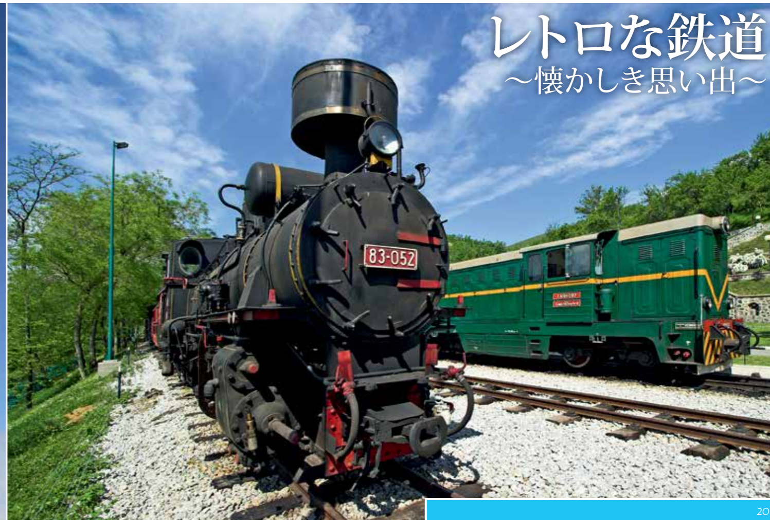
20 | 21

ズラティボルは有名なスパリゾートで、海拔1000メートルほどに位置し、保養地としても知られています。松林をぬける空気の甘さ、鉱泉や澄んだ泉、のどかな小川の流りが、身も心も癒してくれます。冬のズラティボルは、スキー場として、初心者から上級者までスキーを楽しめます。夏は、サイクリングやトレッキングの愛好家で賑わい、様々な文化や芸術イベントが開催されています。近くのシロゴイノ村には、この地方の伝統的な木造家屋の保存状況は素晴らしく、野外博物館になっています。独特な模様で有名な村の女性による手編みセーターもお土産として評判です。