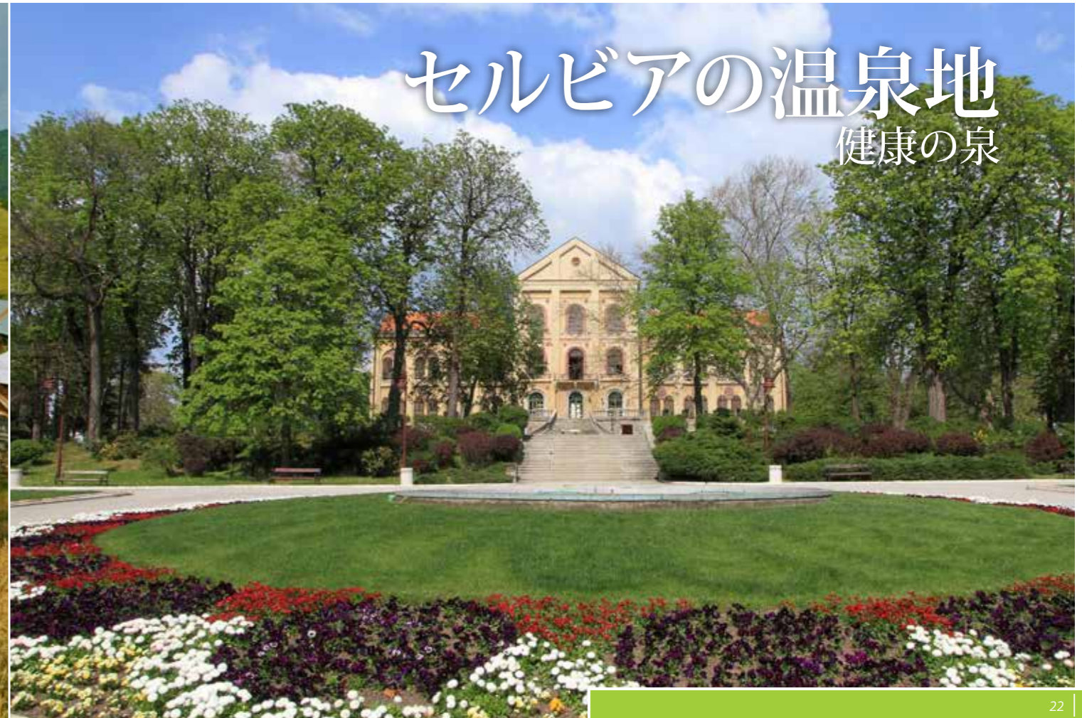
22 | 23

セルビア南部のプロム温泉の近くには、ジャボリャ・パロシュ(デビルタウン)と呼ばれるにふさわしい奇岩群があり、岩山の頂上に石の帽子が載った鋸山のような光景は、一見の価値があります。