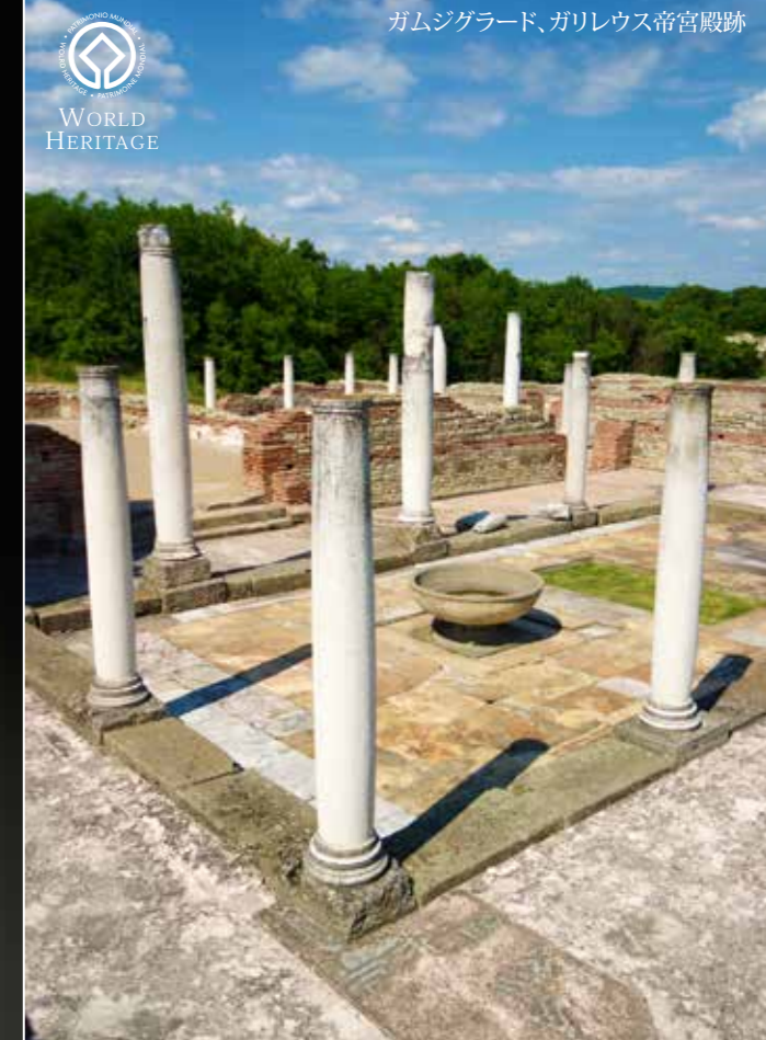
ガムジグラード、ガレリウス帝宮殿跡