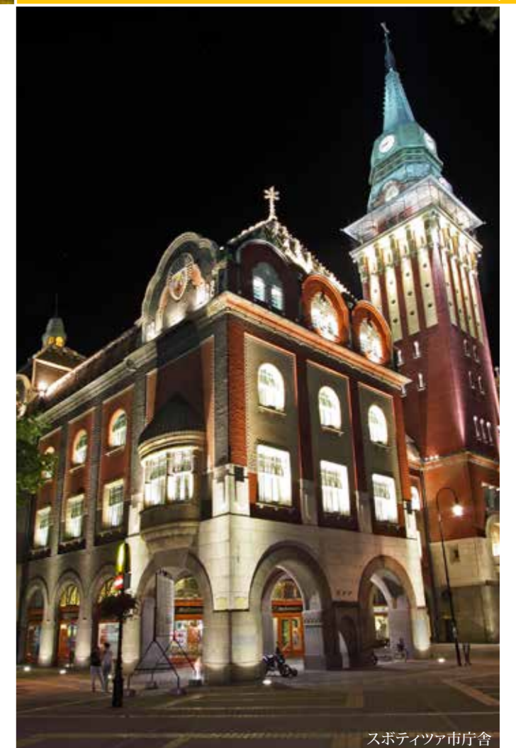
スポティツァ市庁舎