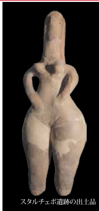
スタルチェボ遺跡の出土品

今日のセルビアには、たくさんの古代遺跡があり、発掘された貴重な出土品は全国各地の遺跡公園や博物館に展示されています。