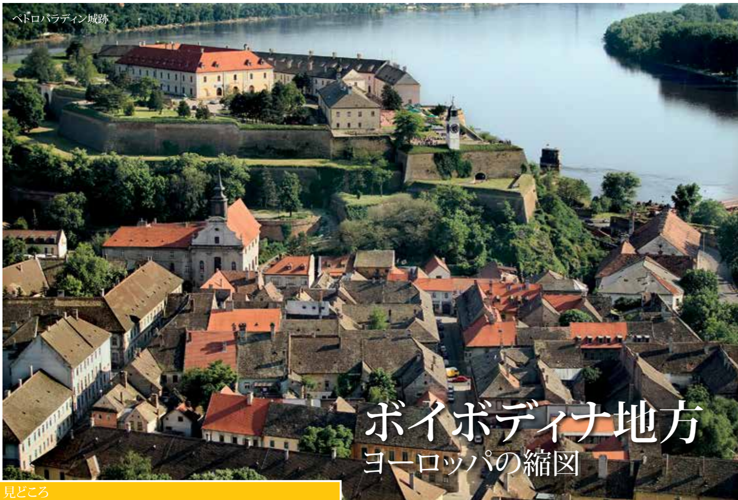
ペトロバラディン城跡