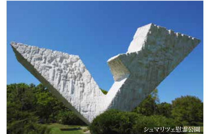
シュマリツェ慰霊公園

そのため、クラグエバツツは初物尽くしの町になりました。この町が首都だったのは1841年までですが、その間に、1833年開校のセルビア初の中等学校をはじめ、劇場や裁判所、市場、新聞社、ベオグラード大学の前身となる高等学校リセー、国会、兵器廠、サッカークラブなどが創設されました。セルビア最初の憲法が書かれたのもこの町です。