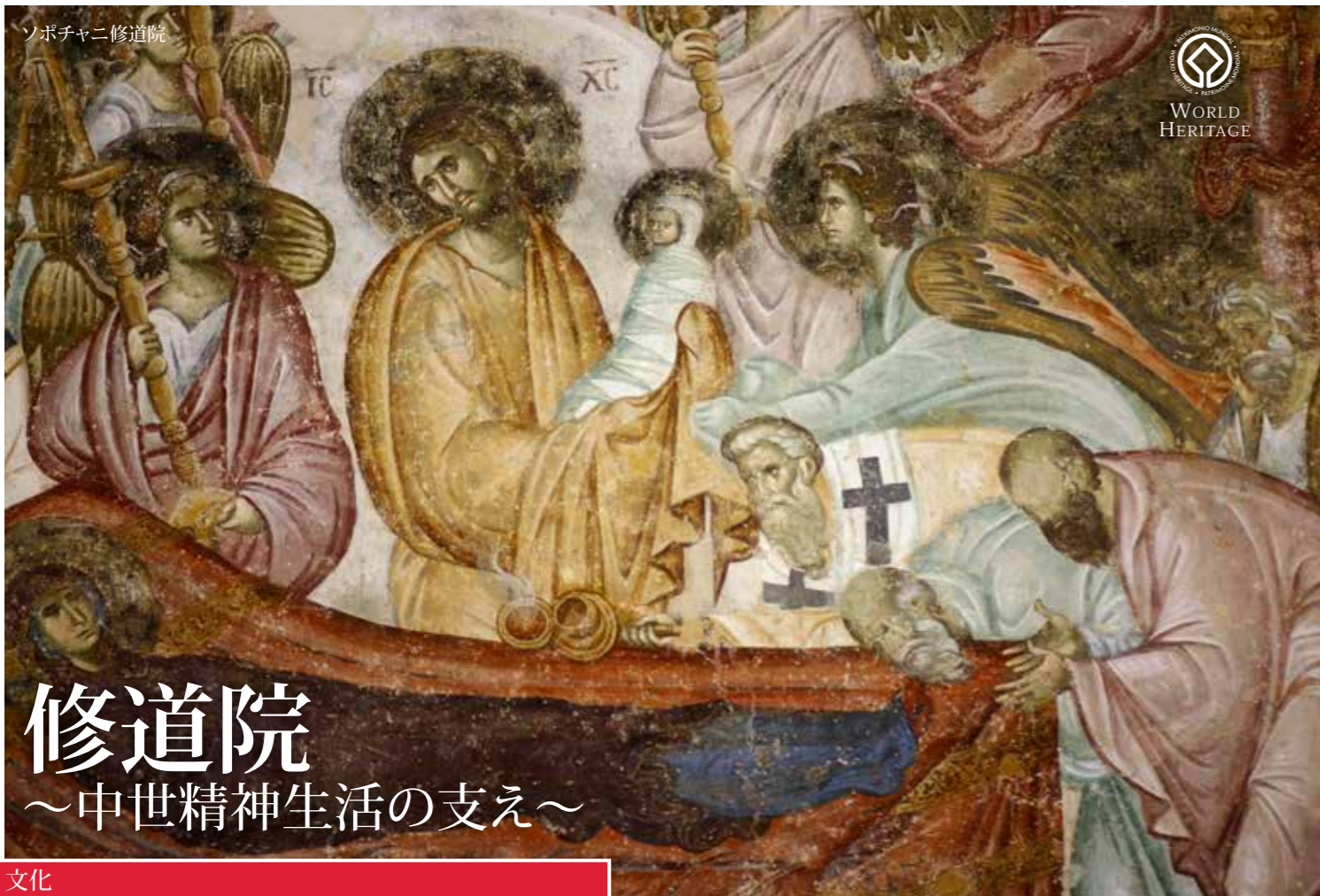
ソポチャニ修道院