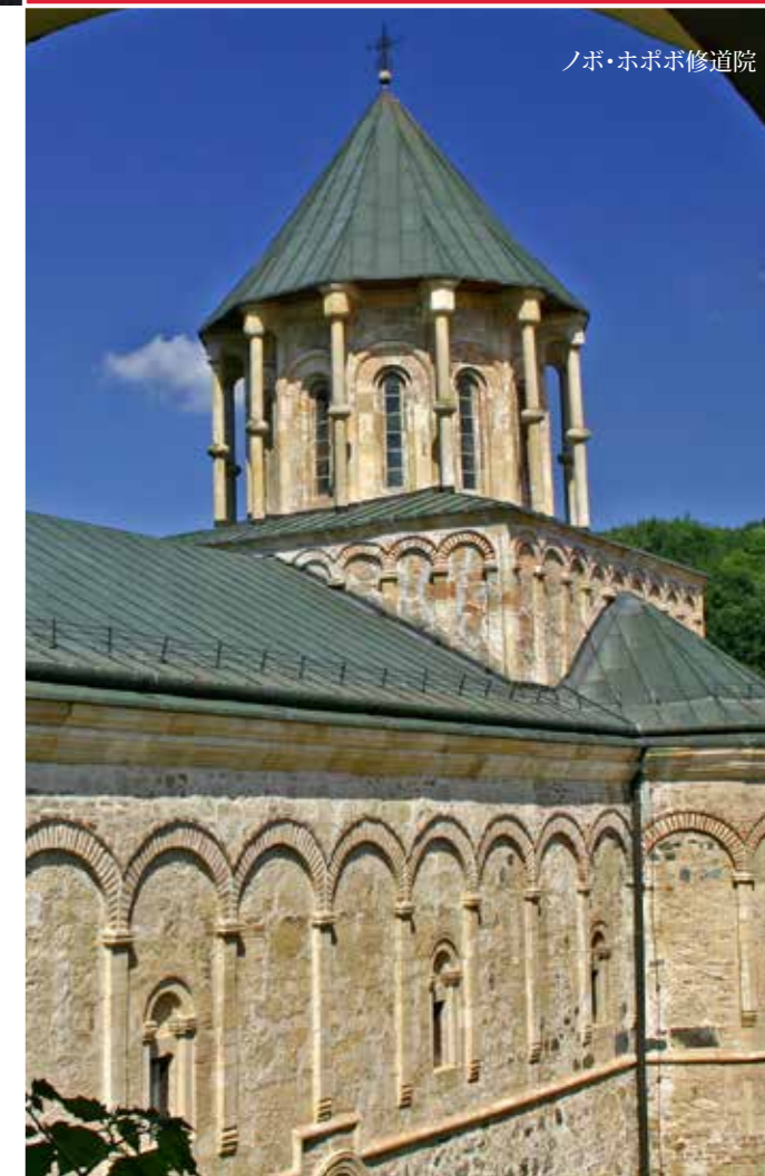
ノボ・ホボボ修道院